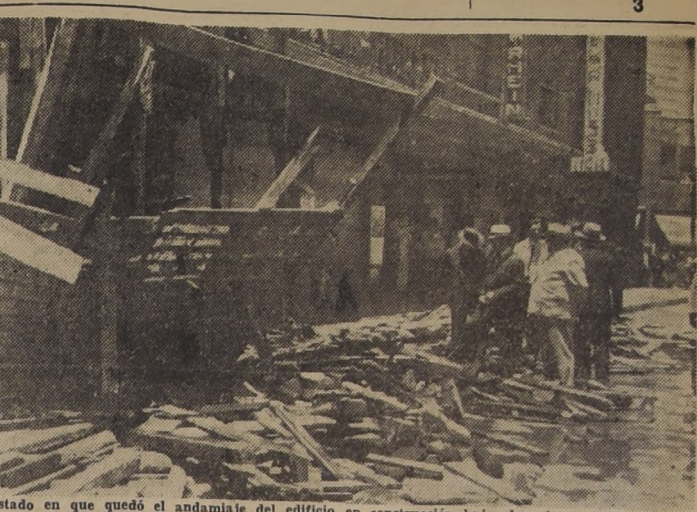
Estado en que quedó el andamiaje del edificio en construcción bajo el cual pasan los cables de la recámara subterránea de la Cia. de Electricidad.