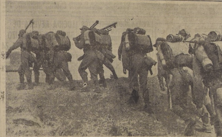
TROPAS ROJAS EN RETIRADA.— Con el despliegue de la División de Caballería y una columna de tanques y carros scouts, que se inició ayer en la madrugada, el bando Rojo fue obligado a retroceder a sus posiciones de paz.— Los rojos, que fueron integrados por efectivos del Regimiento "Guardia Vieja" de Los Andes, muestra en la fotografía una sección de infantería dejando atrás el terreno ganado días antes.— Así se ha terminado una de las maniobras más importantes de los últimos años