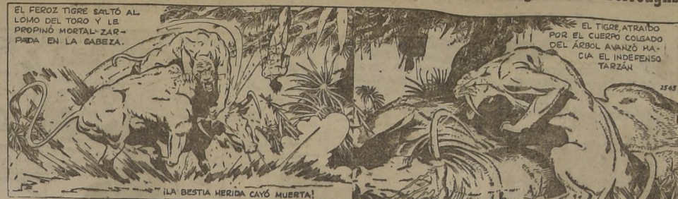
EL FEROC TIGRE SALTÓ AL LOMO DEL TORO Y LE PROPINÓ MORTAL ZARPA EN LA CABEZA. EL TIGRE ATRABÓ POR EL CUERPO COLGADO DEL ÁRBOL AVANZANDO HACIA EL INDEFENSA TARZAN.