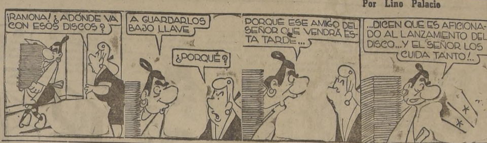
RAMONA! ¿ADÓNDE VA CON ESOS DISCOS? ¿PORQUÉ? ¿PORQUÉ? ¿PORQUÉ? ...DICEN QUE ES AFICIONADO AL LANZAMIENTO DEL DISCO... Y EL SEÑOR LOS CUIDA TANTO!