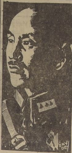
El Generalísimo Chiang Kai-Shek, quien ha reasumido el mando supremo de la China nacionalista, para dirigir la última resistencia en el territorio continental.

Esas fuentes dijeron que se cree que ese reanudamiento de la actividad sea parte de un "ataque general" por los darulislamistas, en un esfuerzo para mejorar su posición antes de la transferencia de la soberanía cuando el ejército indonesio se hará cargo de esa zona.