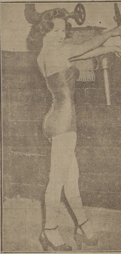
UNA MODELO CAUTIVADORA Hay muchas otras como ellas entre la muchedumbre.