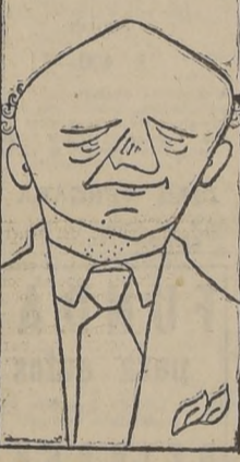
EL PREMIER KOLAROV