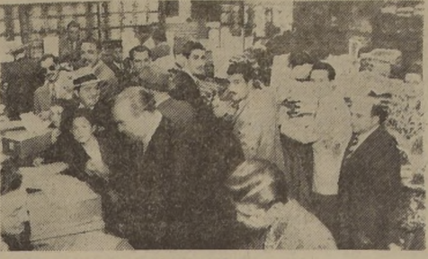
Una de las secciones de Falabella es invadida por el público

Las primeras horas de la mañana de ayer, el día de la liquidación de Falabella, en la Sección Caballeros de la Sección 242, como el lujo local de Damas de Ahuaditas y provincias. El público de siempre está atento a este acontecimiento. Se procura aprovechar esta magnífica oportunidad para hacer, en estos días de aguda crisis económica, gestiones prácticas que provecho a la vida diaria, a costos relativamente rebaja.