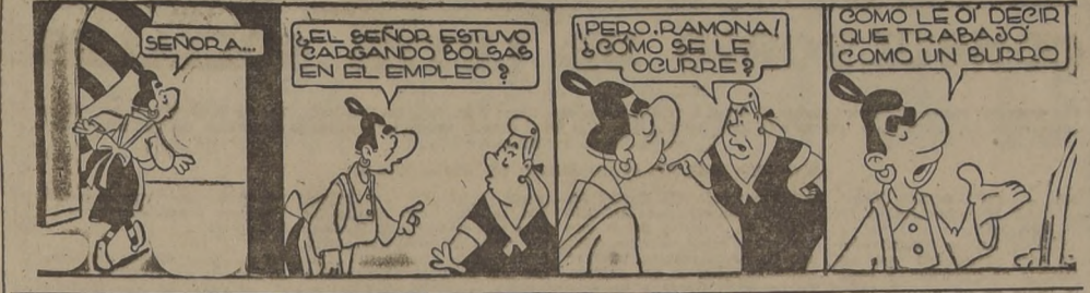
¿EL SEÑOR ESTUVO CADAGANDO BOLSAS EN EL EMPLEO? PERO, RAMONA, ¿CÓMO SE LE OCURRE?