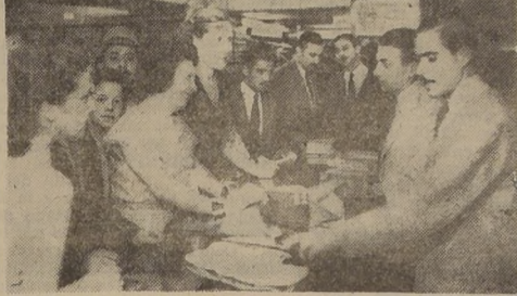
Damas adquiriendo sus mercaderías en la Sección Niños