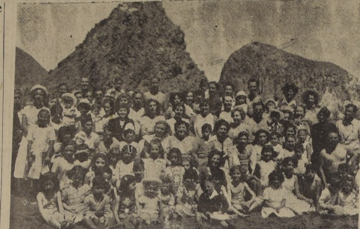
EN LAS PLAYAS DE CONSTITUCION. — El bañarse se anima de nuevo con el bullanguero tráfago de cientos de veraneantes que buscan la grata acogida de las playas durante estos días de tórrido calor. He aquí un grupo numeroso de ellos. Posaron a la salida del baño matinal en el mar para el lente de LA NACION.