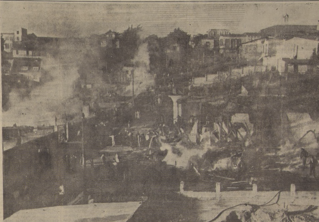
DESOLACION Y TRAGEDIA. — Un aspecto de la calle Olea, que fué arrasada en sus dos costados por el voraz incendio que ayer consumió trece casas del vecino balneario de Cartagena. Esta fotografía tomada a las 18 horas, sólo muestra restos y ruinas, mientras el humo aún surge de los escombros. 260 personas resultaron damnificadas.