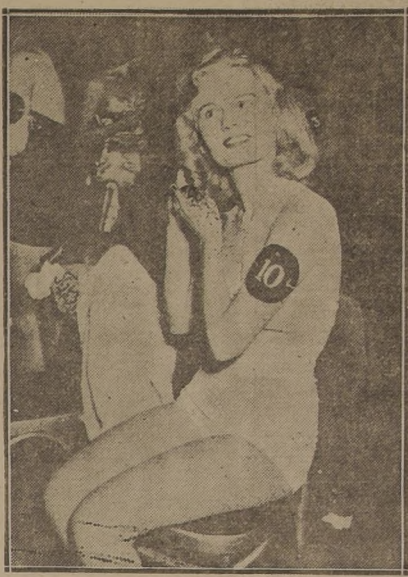
¿ES ESTA UNA COMPETIDORA? Si y también una espectadora.