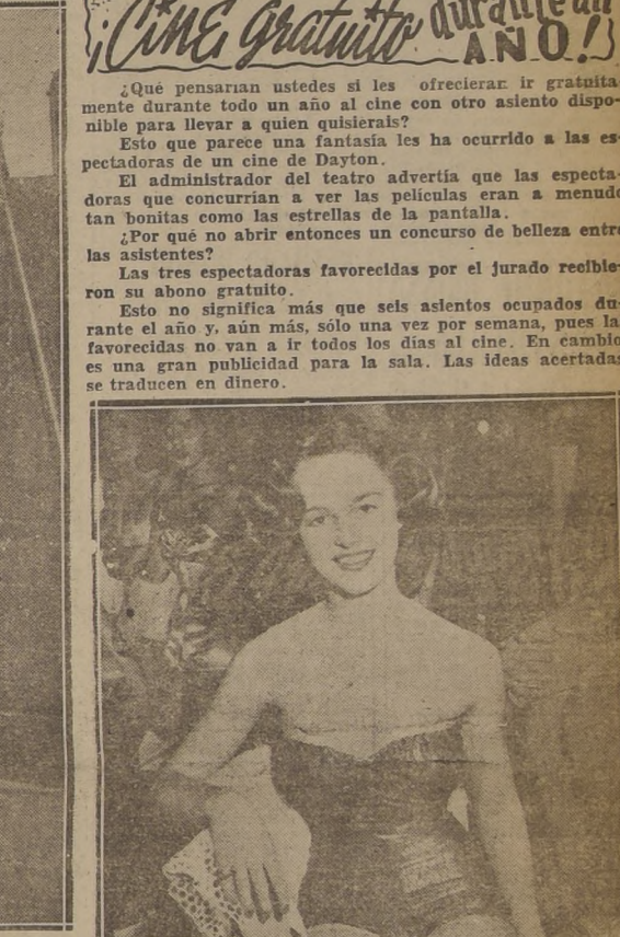
La favorecida tiene derecho de llevar a cualquiera al teatro. De seguro no le han de faltar candidatos...