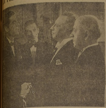
Merle Andrews saluda a Arturo Rubinstein, uno de los más grandes pianistas del mundo, y a Eugene Ormandy, el más prestigioso director de orquesta del mundo.

MERLE OBERON APLAUDIREMOS EN LA PELICULA "MI CORAZON TE GUIA"