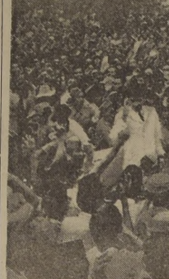
El pueblo de Batavia (Jakarta) rodea y aclama al Presidente Sukarno, a su llegada a la capital. (The Illustrated London News).

El pueblo de Batavia (Jakarta) rodea y aclama al Presidente Sukarno, a su llegada a la capital.