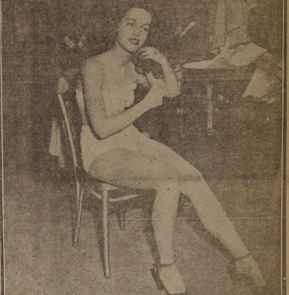
De espectadora, esta hermosa candidata se ha transformado en actriz.