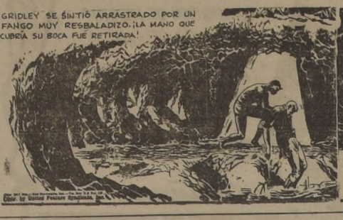
TARZAN EN LA SUPERFICIE. GRIDLEY SE SINTIÓ ARRASTRAO POR UN FANGO MUY RESBALADIZO... LA MANO QUE CUBIA SU BOCA FUE RETIRADA!