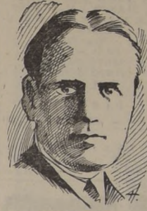
RAFAEL SABATINI ADELBODEN (Suiza), 13.—(UP).— A la edad de 75 años ha fallecido el novelista histórico y romántico Rafael Sabatini...