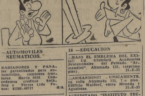
¿SABE TANTO DE CALCULOS... 'QUE HASTA EL MEDICO SE ASOMBRO DE LOS CALCULOS QUE TENIA'