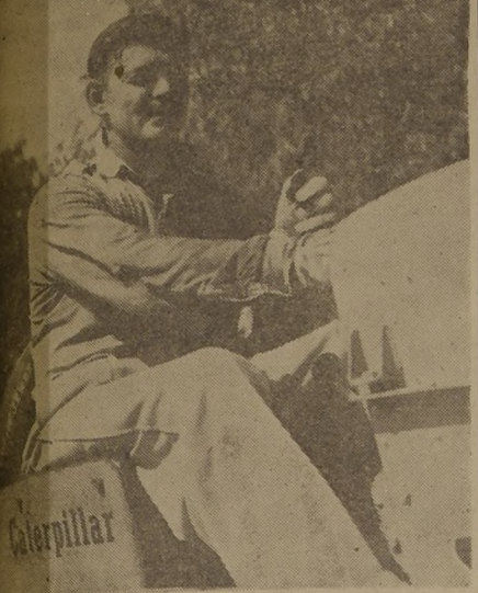
Gable, parece que gusta también de abrir surcos en la tierra, además de conquistar el corazón de millones de admiradoras en todo el mundo. Por lo menos, aquí podemos comprobarlo fotográficamente.

n actor que es bailarín y que además crea sus propios bailes