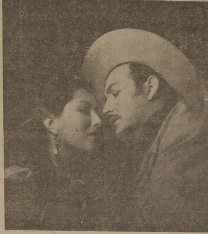
Este es el amor a la mexicana. Aunque aquí aparecen muy unidos la estrella Gloria Marín y el galán Jorge Negrete, hace algún tiempo que dejaron de formar una de las tantas parejas felices del cine mexicano.