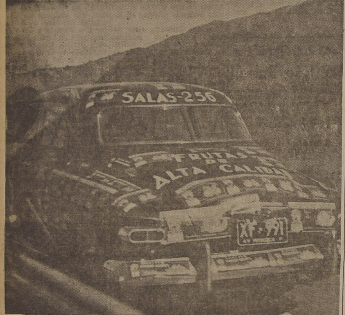
MUESTRARIO DE FRUTAS. — Edmundo Mesa, que pilotó el Studebaker No. 58, decoró la carretera de su coche con estampas de todas las frutas que se producen en el país. Llamó la atención su peso por las diversas localidades. En el grabado vemos a la máquina de Meza aventajando a la que viajaba nuestro reportero gráfico.