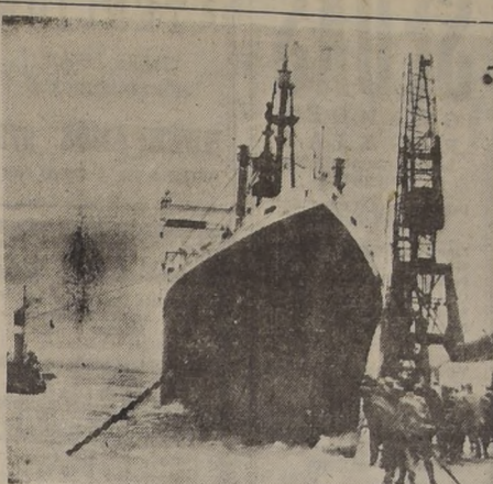
SOUTHAMPTON, Inglaterra.—Numerosos curiosos observan los daños que se ocasionó en la proa del vapor "Washington" cuando un viento huracanado casi de 100 kilómetros por hora precipitó al barco dos veces contra la dársena...