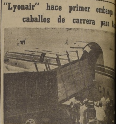
"Lyonnair" hace primer embarque de caballos de carrera para...

Text regarding a public proposal for the exploitation of ports.