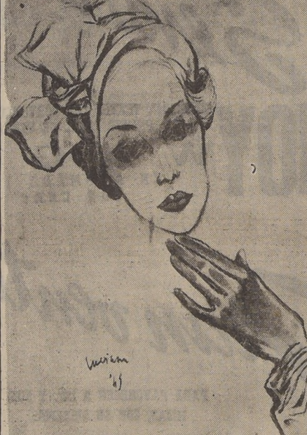
Sombrero de satén rosado con guantes al tono, para el primer gran matrimonio de temporada. En este modelo, de Gilbert Ortel, aparece la sensacional fórmula de dejar libre una parte del peinado, ocultando el resto.

En los zapatos hay innumerables combinaciones, las que se logran con dos distintas clases de cuero, con raso y charol, o con terciopelo y gamuza. Los tacones varían a gusto de cada cual y continúan en boga los zapatos de plataforma y los lazos y trabillas. Vuelven a ganar el favor de las damas los zapatos de punta, cerrada, aunque muchas prefieren aún los de punta abierta, por considerarlos más higiénicos.