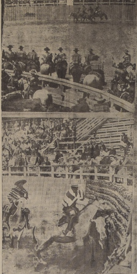
Una fama ya proverbial tiene el rodeo de San Fernando. Es una de las fiestas de destreza criolla, que simboliza de modo más significativo toda la tradición de la gente de campo.