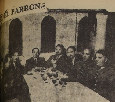
...a la manifestación que los oficiales de la Fábrica Militar... ofreció al señor comandante don...