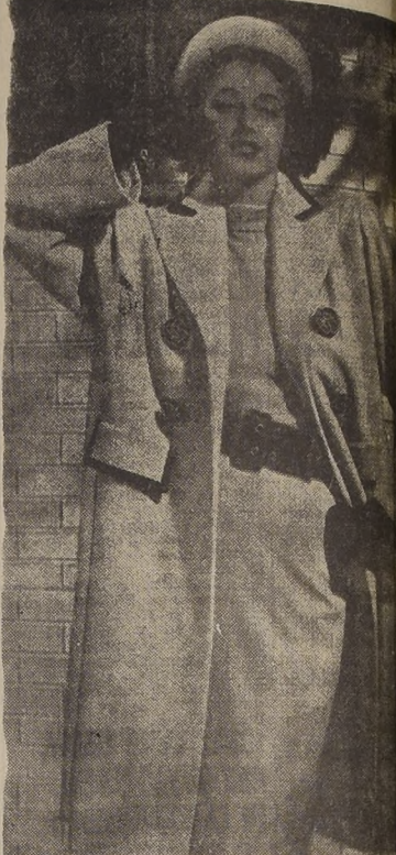
Como anticipo de estación ofrecemos este cómodo abrigo en tono claro. El traje lleva cuello sobrio, ancho cinturón de cuero. El abrigo está adornado con terciopelo y botones dorados a fuego. Se complementa con sombrero pequeño en estilo bolero con plumas de