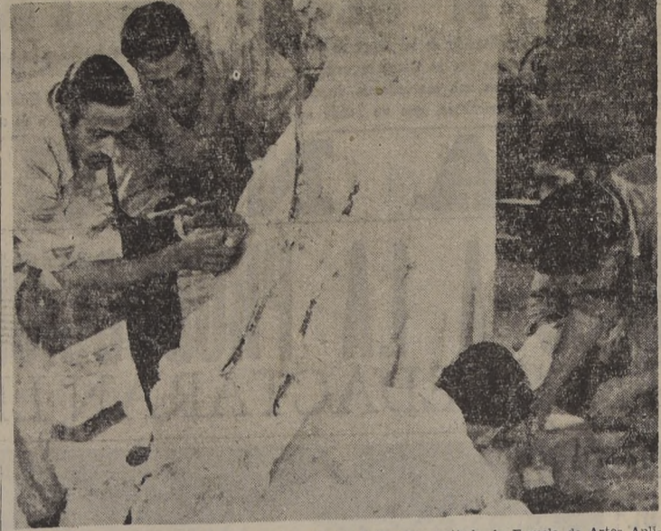
TRABAJAN EN PESIMAS CONDICIONES.— En un taller desvencijado, la Escuela de Artes Aplicadas de la Universidad de Chile...