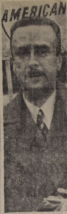
Claudio Arrau, a Lima.— Vía el Interamericano de la Panagra...