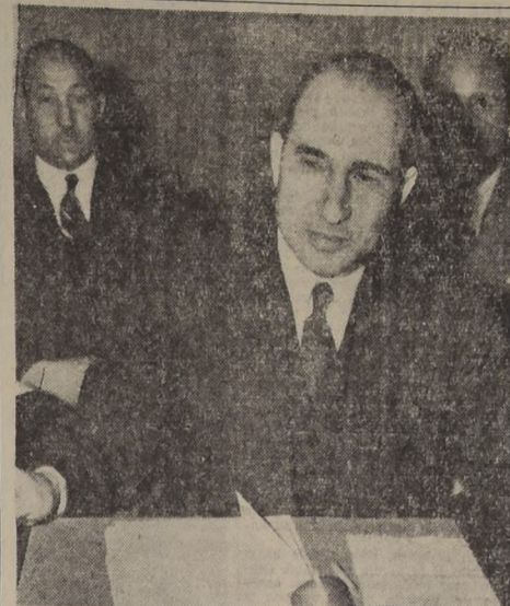
LAKE SUCCESS.— Mahmoud Bey Fawzi, nuevo presidente del Consejo de Seguridad de las Naciones Unidas, dirigiendo el debate en Lake Success. Antes de iniciar el período de su presidencia, este delegado egipcio aseguró que las Naciones Unidas estaban "prácticamente" tan abandonadas a su suerte como lo estaba la Sociedad de Naciones. Cito varios de sus fracasos y dijo que la estructura de la paz y seguridad mundiales se estaba tambaleando.

WASHINGTON, 16. (UP).— El Presidente Truman regresó a las 3:40 P. M. de la gira de 9,600 kilómetros a través del país, estimulado por la buena acogida que tuvo por grandes muchedumbres, y con el ánimo de que su partido Demócrata saldrá más fortalecido después de las elecciones al Congreso el próximo noviembre. En el discurso final de su gira pronunciado desde el tren en Cumberland, Estado de Maryland, el Presidente declaró: "Ayer en Chicago expuse un detalle por detalle, exactamente lo que es la plataforma del Partido Demócrata, lo que está tratando de ofrecer a los republicanos a que presenten algo mejor". El Presidente fue en seguida a la mansión Blair y después se enfrenó en el trabajo que se ha acumulado durante su ausencia de nueve días.