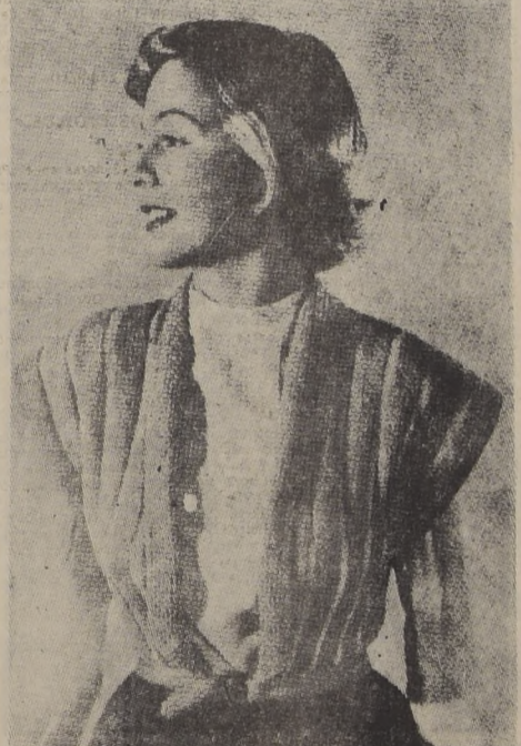
BLUSON TEJIDO.— Precioso blusón tejido en lana delgada. Se ejecuta a lo largo en combinación de canutos derecho y co-reteado, en forma quimono. Muy práctico para las oficinistas, que pueden llevarlo sobre las blusas.