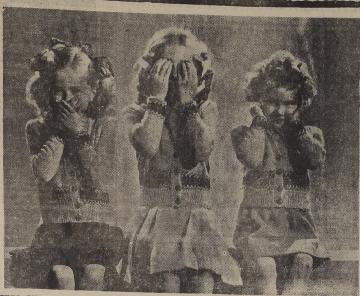
TRES CHALECOS PARA NIÑITAS.— Chalequitos en punto de jersey para 5, 7 y 9 años, confeccionados en lana color beige o masilla, con guardas en colores rojo y azul que adornan los puños y las cinturas. Se abotonan con cuatro botones adelante.

bién extraño, porque, por simple lógica, la relación de padres e hijos debería ser la más estrecha entre las relaciones humanas.