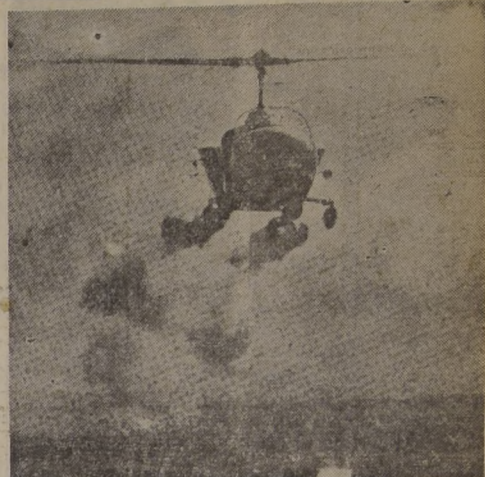
El helicóptero, un auxiliar moderno de los agricultores.

Sin duda, no está muy lejos el día en que el campesino podrá, además de su arado, sembradora, segadora, astadora y trilladora, del arma más moderna para la lucha contra las enfermedades de las plantas y los insectos dañinos: el helicóptero. Una sola de estas máquinas, provista de un equipo de pulverización y volando a pocos metros del suelo, permitirá realizar el mismo trabajo que los aparatos usados actualmente, con igual eficacia y extraordinario ahorro de tiempo. El helicóptero se encuentra aún en las primeras etapas de su desarrollo, y por lo tanto, puede ser objeto de muchas mejoras, y en este sentido se realizan trabajos intensivos en varios países. Sin embargo, ya es posible emplearlo con éxito en diversos trabajos. Recientemente se realizó una interesante prueba en Estados Unidos, en la cual el piloto recogió con la mayor facilidad un puñado del suelo, mediante un pequeño gancho unido al tren de aterrizaje.