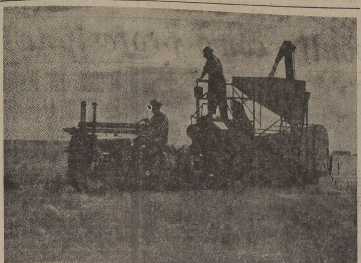
Mientras la producción de América Latina ha subido apenas en un 14 por ciento, la población ha aumentado en un 24 por ciento.

El crecimiento de la población mundial, según los datos estadísticos, entre 1940 y 1950, por ciento, se eleva a 20 por ciento, lo que implica un aumento de la producción de alimentos por lo menos en un 20 por ciento anualmente, respondiendo a una de las principales tareas de la Organización de las Naciones Unidas para la Agricultura y la Alimentación (FAO), un organismo especializado de las Naciones Unidas, en Santiago. M. Raymond Echeats, en un viaje a Buenos Aires, ha visitado en numerosas ocasiones anteriores — para realizar estudios en el campo de la agricultura en América Latina — a la FAO, la Organización de las Naciones Unidas para la Agricultura y la Alimentación (FAO), un organismo especializado de las Naciones Unidas, en Santiago. M. Raymond Echeats, en un viaje a Buenos Aires, ha visitado en numerosas ocasiones anteriores — para realizar estudios en el campo de la agricultura en América Latina — a la FAO, la Organización de las Naciones Unidas para la Agricultura y la Alimentación (FAO), un organismo especializado de las Naciones Unidas, en Santiago.