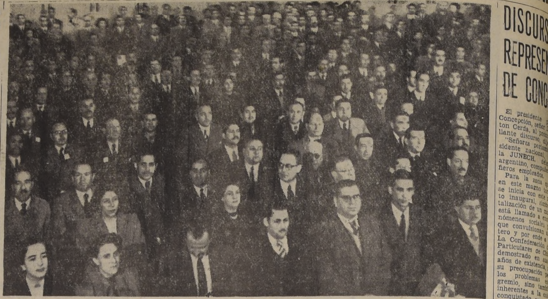
Aspecto parcial de la concurrencia a la inauguración del Segundo Congreso Nacional auspiciado por la Confederación de Empleados Particulares de Chile, en el Teatro Baquedano

HOY A LAS 10 HORAS SE REALIZA PRIMERA SESION PLENARIA