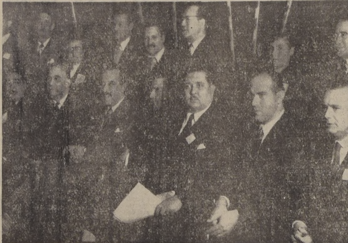
Parte de la mesa de honor en la inauguración de la Segunda Convención