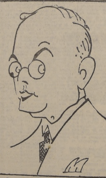
John Foster Dulles, asesor del Departamento de Estado de los Estados Unidos, quien ha declarado que la guerra fría se halla en su fase decisiva.