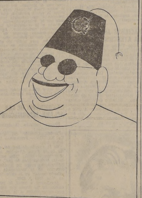
El Rey Faruk, de Egipto, que ha destituido a 17 senadores que en 1944 fueron nombrados incorrectamente.