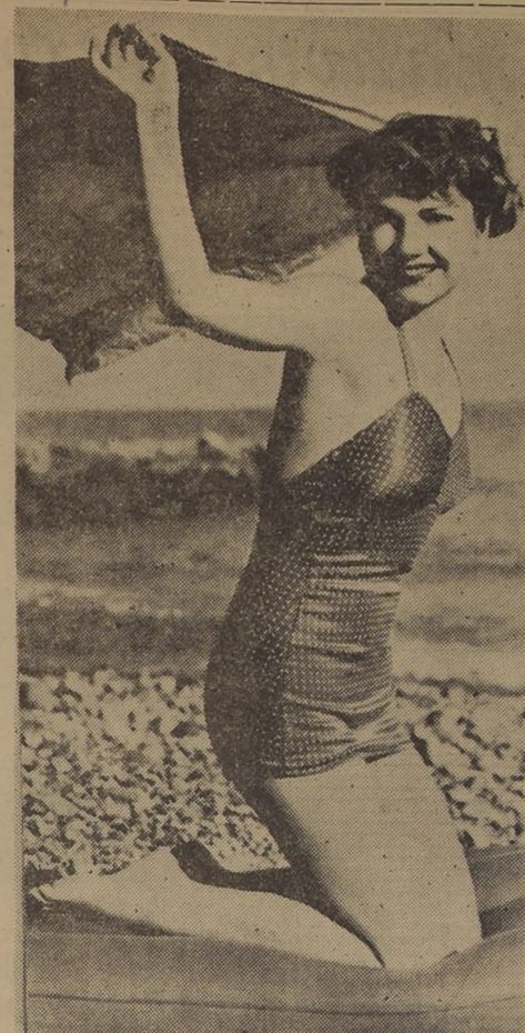
ANNE BAXTER aprovecha los instantes que le deja libre su intensa labor en los sets, para solazarse con el aire y el sol a orillas del mar.

Pero hacia el mediodía — cuando a "29th Century Fox" el sol aprieta que es un contento. El estudio de cine está lejos de Hollywood; lo menos media hora de automóvil (si el tránsito no se estanca). Cuando cruzo la verja exterior estoy casi sofocada. Es con alivio que entro al "set" en que trabajan, en la misma escena, dos amigas mías, Anne Baxter y Celeste Holm.