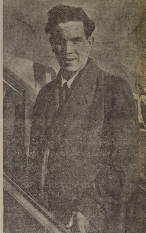
Se dirigió ayer a Río de Janeiro, vía el Interamericano de la Panagra, el crack Jorge Robledo, quien esperará en esa ciudad al resto del equipo chileno que tomará parte en el Campeonato Mundial de Fútbol. Como se sabe, Robledo viajó directamente a Londres, una vez finalizada su actuación en el importante torneo. Se reintegrará a su club, el Newcastle United, que lo facilitó a la Federación de Fútbol de Chile.

En el avión de la Panagra se dirigirá hoy a Buenos Aires, para seguir después a Río de Janeiro, la delegación que representará a la Federación de Fútbol de Chile, en el Campeonato Mundial de Fútbol que se efectuará en Brasil, en disputa de la copa "Jules Rimet".