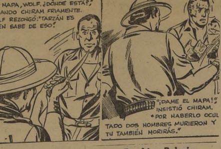
Por Lino Palacio

MUEBLES ALTA CALIDAD. Enorme surtido. Muebles para niños. Amplios créditos. Mueblería "Confort".