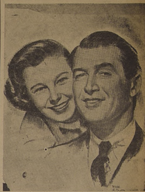
James Stewart y June Allyson comparten honores estelares, por primera vez, en la cinta de la Metro Goldwyn Mayer "RETORNA EL CAMPEÓN", conmovedor drama romántico basado en la espectacular carrera de un astro deportivo, Frank Morgan, Agnes Moorehead y Bill Williams son otros protagonistas importantes en esta nueva producción de la M. G. M., que se estrenará el jueves en el teatro Metro.