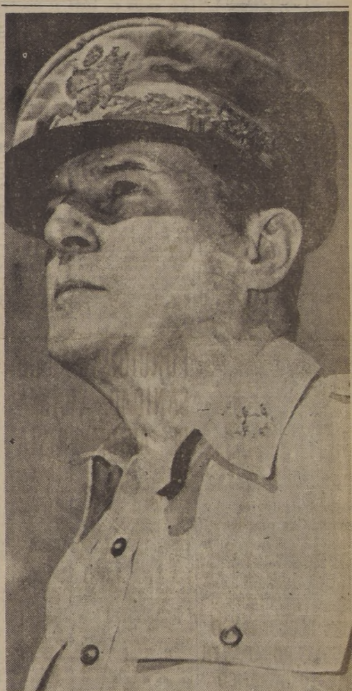
DIRIGE EL AUXILIO A COREA MERIDIONAL.— Desde Tokio, el general Douglas Mac Arthur dirige las operaciones de ayuda a la resistencia coreana contra la invasión comunista. Ochenta aviones de retropropulsión, seguidos por aviones E-46 se dirigieron ayer a reforzar a las fuerzas defensoras. Mientras tanto, otras unidades iniciaron sus operaciones en el campo de batalla, a pesar del mal tiempo. Seis cazas soviéticos fueron derribados. Por su parte, la Séptima Flota norteamericana envió varias unidades a proteger Formosa.

WASHINGTON, 27. (U. P.).— (Por Donald J. González).— El Presidente Truman anunció que ha ordenado a las fuerzas aéreas y navales norteamericanas que apoyen a las fuerzas de Corea meridional en su lucha contra los invasores comunistas de Corea septentrional. Al mismo tiempo, Truman anunció que también ha ordenado a la Séptima Flota norteamericana que "impida cualquier ataque contra Formosa", isla-fortaleza, donde los nacionalistas chinos, que dirige el generalísimo Chiang Kai-shek se han concentrado después de ser expulsados del continente por los comunistas. El Presidente en su declaración dijo que el ataque comunista contra Corea meridional, "demuestra, sin dejar lugar a dudas, que el comunismo ha ido más allá del uso de la subversión para conquistar a las naciones independientes, y utilizarlas". (A la página 12, columna 5)