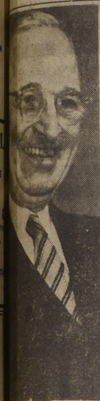
TRUMAN, Presidente de los Estados Unidos, que ordenó a las Fuerzas Aéreas norteamericanas en el Oriente, particularmente acciones bélicas en Corea, una decisión de Truman elogiada en todos los países del mundo.