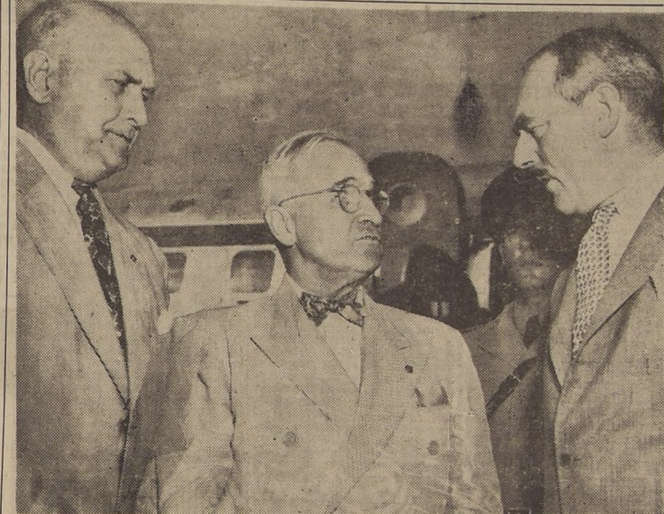
INFORMAN A TRUMAN DE LOS SUCEOS DE COREA.— Washington.— Después de cortar sus vacaciones veraniegas en su pueblo de Independence, Missouri, el Presidente Truman llega a Washington, e inmediatamente es informado de los acontecimientos de Corea por el Secretario de Estado, Dean Acheson, y el Secretario de Defensa, Louis Johnson. La seriedad del rostro de estos tres hombres de Estado está demostrando la gravedad de los sucesos del Lejano Oriente.

UN VALIOSO AUXILIAR PARA LA MUJER Eva DE HOY EN UNA EDICION ESPECIAL A PRECIO CONVENIENTE, dedicada a LABORES Y TEJIDOS ADQUIRALA, LE INTERESARÁ!