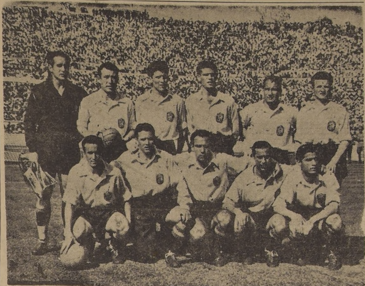
LLEVA DOS TRIUNFOS.— En forma más estrecha y difícil que como ganó a Estados Unidos (3-1), ayer el conjunto de España se impuso a Chile, por 2-0. Debó apelar a todos sus recursos y luego defender arduamente la ventaja, retrasando a los insiders que fueron a colaborar con la zaga y medizaga. El Selecciónado español formó con: Ramallets; Alonso, Parra y Gonzalo Segundo; Gonzalo Tercero y Puchades; Basora, Igoa, Zorra, Panizo y Galnza.

RIO DE JANEIRO, 29 (U. P.). — Brasil y Yugoslavia jugarán el único partido correspondiente al 1.º de julio. El partido se realizará en Río de Janeiro y se jugará a la colocación de los participantes en el seleccionado representativo local.