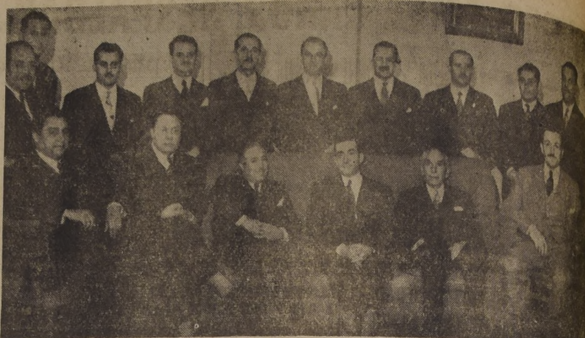
ALMUERZO EN EL CLUB PERUANO. — Ayer se llevó a efecto en el Club Peruano, el almuerzo que ofrecía como iniciación de sus actividades sociales...