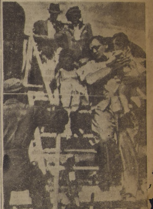
HUYEN DE LA AMENAZA COMUNISTA—Tokio.— Primeros escuadros norteamericanos del sur de Corea llegan a Itazuki sur del Japón después de haber sido traídos por la Fuerza Aérea de EE. UU., desde la base aérea de Kimpo, cerca de Seúl.