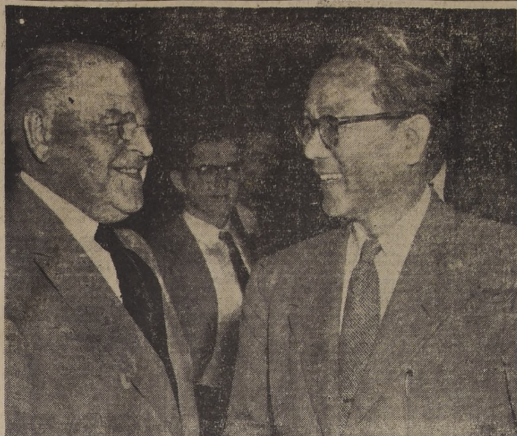
AUSTIN FIDE SEVERAS SANCIONES CONTRA COREA DEL NORTE.— LAKE SUCCESS, Nueva York.— El jefe de la Delegación norteamericana, Warren G. Austin, conversa con el Embajador de Corea del Sur en Washington, John Chang, antes que el primero pidiera a nombre de los Estados Unidos al Consejo de Seguridad de las Naciones Unidas "severas sanciones" contra Corea del Norte por invadir y agredir a Corea del Sur. La medida fué aprobada por el Consejo.

WASHINGTON, 30.—(UP).— El Senado convocó a una sesión especial el sábado, para estu- diar la imposición de nuevas res- tricciones a las actividades co- munistas en Estados Unidos. En esa sesión se considerará un proyecto que se refiere a la inscripción de los miembros del Partido Comunista así como de las organizaciones denominadas pro comunistas, por el Departa- mento de Justicia. Además, puede enviarse por valor de 250 millones de los perrechos sobrantes norteamer- icanos. Encima de todo eso, Truman puede transferir hasta 122.250.000 de los fondos a cual- quier país cuya defensa consi- dere importante para esta nación y puede vender armas norteamer- icanas en cualquier parte del extranjero sobre la misma base.