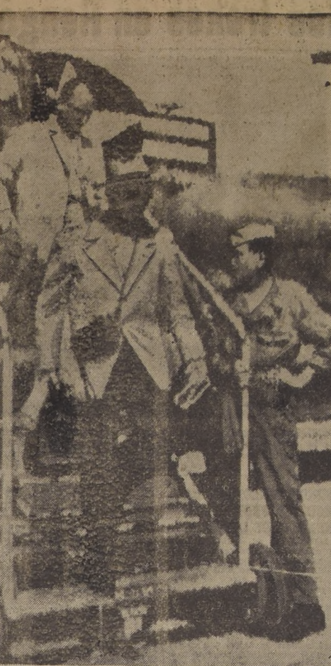
LEGAN LOS PRIMEROS NORTAMERICANOS EVACUADOS DE COREA.— TOKIO.— Desembarcan de un avión de transporte de la Fuerza Aérea de los Estados Unidos los primeros refugiados norteamericanos traídos del sur de Corea. Estos evacuados llegaron a la base aérea de Kyushu, en el sur del Japón..

Antes, que fueron lanzados en Corea, notificando a los nativos sobre la ayuda militar norteamericana.