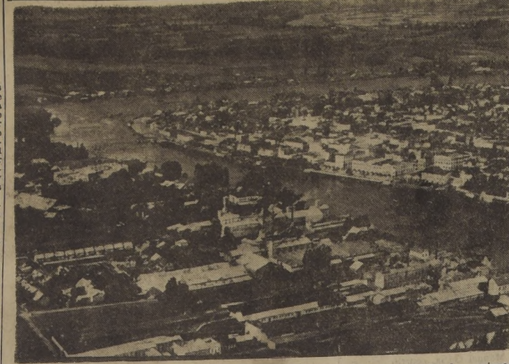
Valdivia se apresura a celebrar su Cuarto Centenario. Representantes de todos los sectores de la ciudad participan en las comisiones que ha constituido la Municipalidad. Hay un comité que tiene la tarea de solicitar el apoyo del Gobierno y del Parlamento para algunas obras de adelanto que contribuirán a realzar la conmemoración del Centenario.

La Cruz Roja, con todos sus elementos; el Cuerpo de Bomberos; Carabineros, Investigaciones, Policía, etc., acudieron al sitio del accidente y se dieron a la febril tarea de recorrer los coches desahucados, rescatando a los heridos y socorriendo a los heridos.