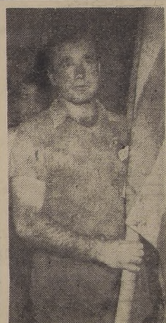
PAZ.— Experimentado arquero de la selección uruguaya que debutará mañana en el Campeonato Mundial frente a Bolivia. Con solo ganar este partido el cuadro oriental quedará clasificado para la final.

RIO DE JANEIRO, 30.—(U. P.).—España obtuvo un triunfo en el Torneo Mundial de Fútbol, dominando a Chile en la primera parte del partido que sostuvieron esta tarde y anotándose en ese período los dos goles que le dieron el triunfo. Sin embargo, los chilenos no fueron adversarios fáciles, pues jugaron de igual a igual largos períodos, y con un claro aunque leve dominio en la segunda parte del partido.