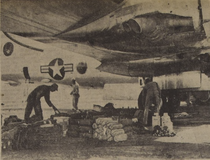
BASE DE LA FUERZA AEREA EN MARCH, California. — La tripulación de un B-29 revisa el equipo de vuelo y abastecimientos debajo de un ala de la máquina antes de emprender la travesía del Pacífico, rumbo a la Corea.

El traslado de las personas de la frontera al interior, comenzó el 25 de julio. En algunos casos se trasladó a todos los habitantes de algunas poblaciones.