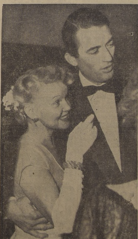
El galán Gregory Peck llega a una fiesta acompañado de su esposa Grete, de quien es inseparable. Hasta ahora, es una de las parejas más unidas de Hollywood.