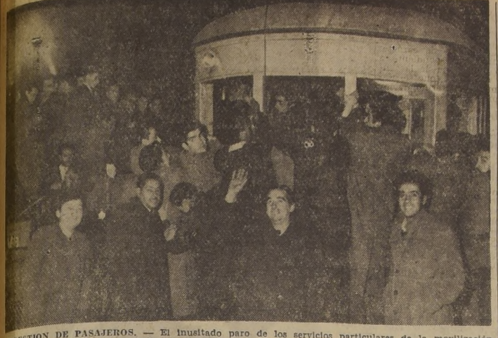
CONGESTION DE PASAJEROS. — El inusual paro de los servicios particulares de la movilización, producido ayer en una extraordinaria congestión de pasajeros en los servicios de la ENT, cuyos vehículos sufrieron graves daños por este motivo. Veinte tranvías resultaron con sus vidrios rotos, y uno quedó totalmente inutilizado en la Alameda, debiendo ser remolcado hasta el depósito. Los autobuses y buses también recibieron destrozos. El grabado muestra un tranvía 36, repleto de pasajeros, y a su lado uno de los camiones que improvisaron colectivos para movilizar a la población.