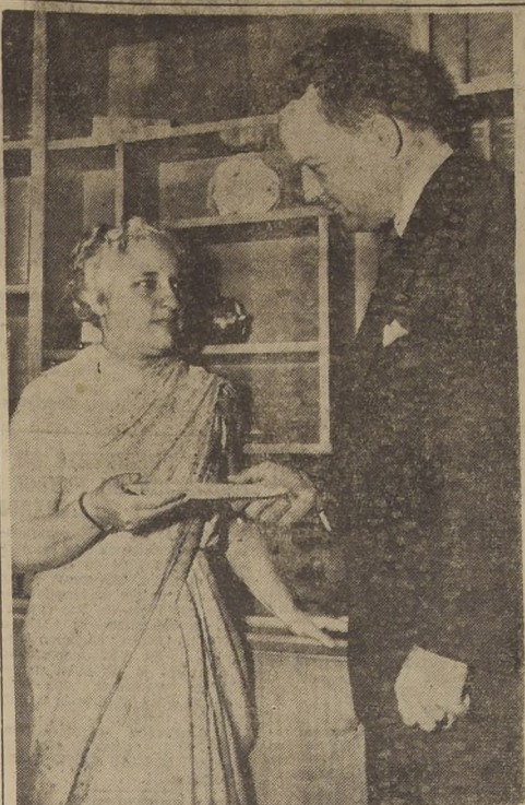
LA GUERRA EN COREA (Washington).—Madam Pandit, Embajadora de la India en los Estados Unidos y hermana del Primer Ministro hindú, Nehru, recibe la nota norteamericana de respuesta a la que este último dirigiera al Gobierno de Washington, ofreciéndole su mediación en la crisis de la guerra de Corea.

TOKIO, viernes 28. (U.P.).—(Por EARNST HOBERECHT).—Las fuerzas comunistas lanzaron hoy un ataque en gran escala contra el frente norte, americano, en un nuevo esfuerzo por reducir la cabeza de playa de las tropas de las Naciones Unidas en Corea.