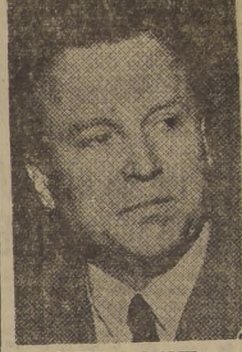
JACOB A. MALIK

LAKE SUCCESS, 27.—(U.P.).—El jefe de la delegación soviética ante las Naciones Unidas, Jacob A. Malik, informó a la or-