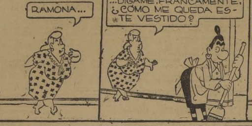
NO PUEDO, SEÑORA...