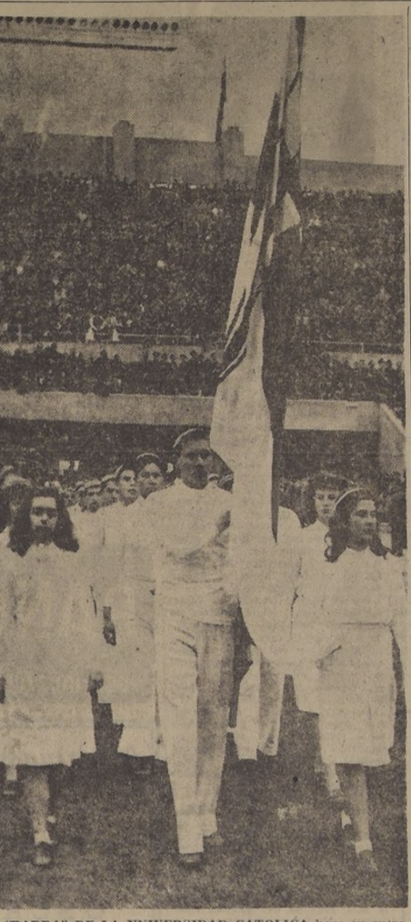
LA "BARRA" DE LA UNIVERSIDAD CATOLICA hace su entrada a la cancha en uno de los últimos "clásicos" universitarios diurnos. Para el que se realizará el domingo 3 del mes próximo, hace ya 60 días que se están ensayando las "barras" de ambos planteles. Se cree que el Estadio Nacional volverá a tener uno de sus grandes llenos.

Un premio al mejor árbitro del Torneo, representante del Fuad Hirma.