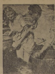
Una escena de "Stromboli" la producción del director italiano Roberto Rossellini, donde el papel principal corre a cargo de la notable estrella sueca Ingrid Bergman. Es una producción RKO Radio Pictures, que se estrenará en breve en Santiago.