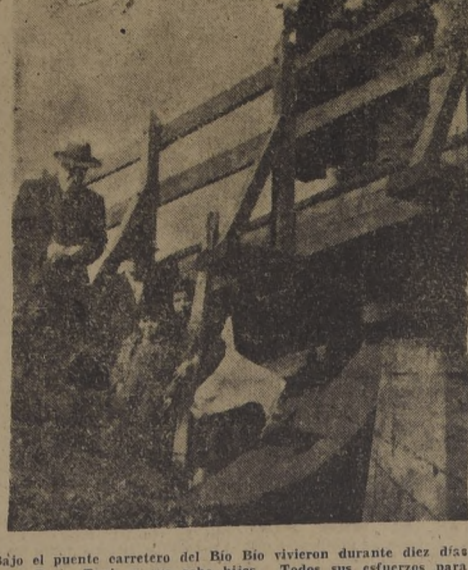
Daño a la puente carretera del Bio Bio vivieron durante diez días...