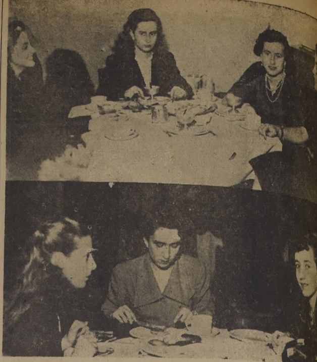
BENEFICIO PARA LAS CONFERENCIAS DE SAN VICENTE DE PAUL. — Aspecto del té de beneficio realizado allí bajo los auspicios del Comité de las Conferencias de San Vicente de Paul, de la Parroquia de El Salvador, con el fin de allegar fondos para sus numerosas obras sociales.