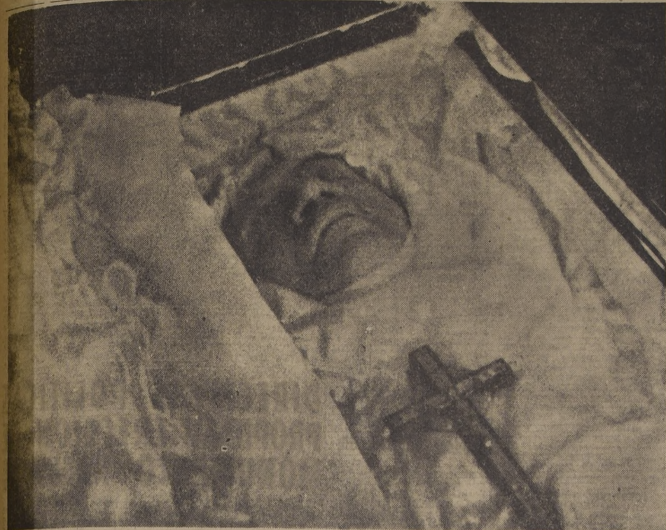
REPOSA TRANQUILO EN SU ULTIMO LECHO. — En la faz del más ilustre de los chilenos no hay un adó gesto de inquietud. Murió como quería. "La Providencia, dijo, fué magnánima con mígo. Le pidió que me dé una muerte repentina". Y así fué. Ha ido con la tranquilidad del hombre que cumplió su deber con su patria y con su pueblo hasta sus últimos momentos.

Un ataque al corazón lo abatió ayer a las 16.55