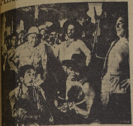
Impresionante escena de "La voragine", film que el martes estrenará el Santiago.

Con un reparto que incluye al actor español Armando Calvo, a la nueva estrella Alicia Caro y al conocido actor René Cardona, la película "La voragine" será estrenada el martes que viene en el Santiago. Esta cinta se basa en una de las novelas más fieles de nuestra América en uno de los documentos literarios más crudos y violentos que jamás se hayan escrito. La recia obra del escritor José Eutasio Rivera ha sido llevada ahora a la pantalla en una realización que enorgullece a la cinematografía mexicana.