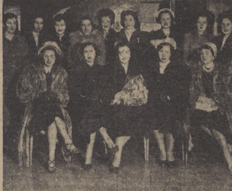
En los Salones "WALDORF" se efectuó una manifestación de despedida a la señora Asea de Furman con motivo de su próximo viaje a Europa.