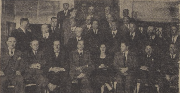
EN EL NURIA.—Manifestación de la Federación de Educadores de Chile, a parlamentarios, dirigentes gremiales y funcionarios que colaboraron en el despacho de la ley de aumento de sueldos.