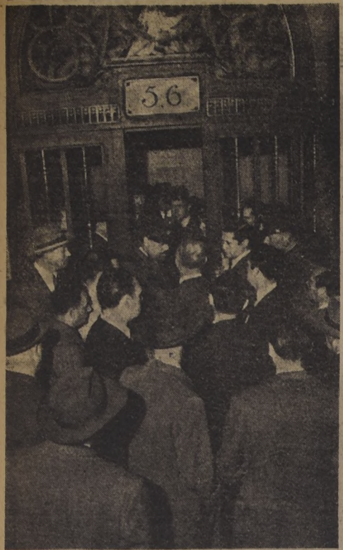
CONSTERNACION Y DOLOR. — El edificio de Phillips 56, cerró sus puertas, poco después de las 18 horas de ayer. En su interior estaba un hombre que rigió los destinos de un pueblo por más de 30 años. Yacía inerte. Afuera, el pueblo rendía, en silencio impresionante, el homenaje de su reconocimiento al que todo lo dio por su patria.