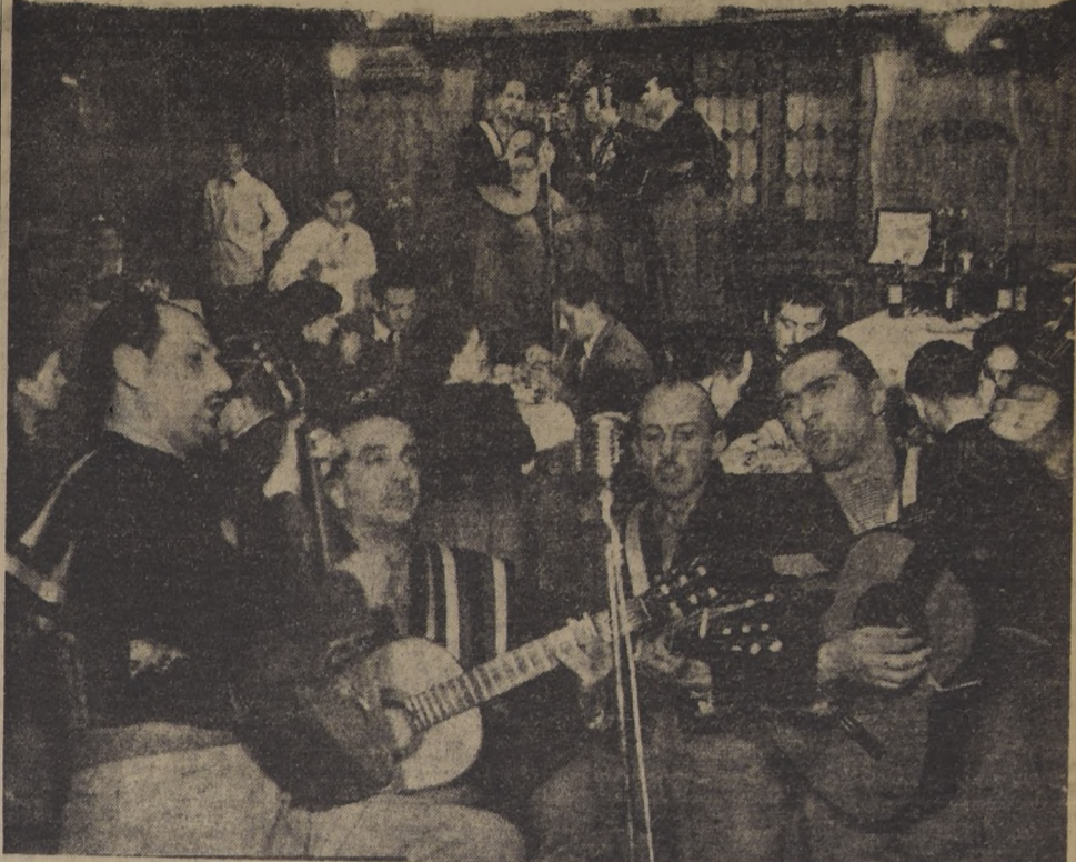
El aplaudido conjunto "Los Quincheros", de exitosa actuación en el país y en el extranjero, recita sus brillantes actuaciones en el escenario de la Taberna del "Capri", donde noche a noche son calurosamente aplaudidos por sus diversas interpretaciones del cancionero criollo e internacional. Esta nueva atracción de la Taberna ha sido muy bien recibida por el numeroso público que los aplaude cariñosamente por el buen gusto artístico en escoger las canciones que son más del agrado de los habitués del Capri.