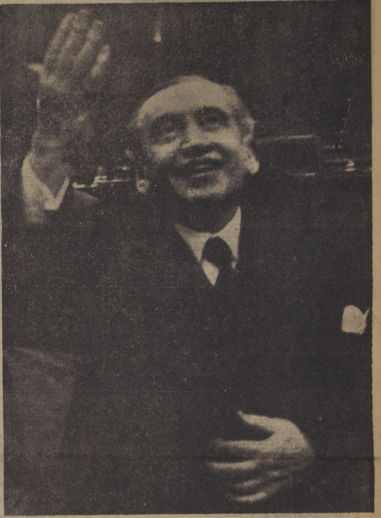
FUE SU AGRADECIDO GESTO. — 30 años después, don Arturo Alessandri Palma, el ilustre estadista desaparecido, repite en este grabado el agradecido gesto que siempre tuvo para su querido pueblo en los últimos años de su vida; para su "querida chusma" el año 20. Vivió toda su vida junto a las multitudes. Murió sólo, a la entrada de una casa, amparado en su agonía dolorosa por una mujer.

A las 16.55 hrs. de ayer falleció el Presidente del Senado, don Arturo Alessandri Palma, en Lira N.º 17, víctima de un ataque cardíaco. El ilustre republico desaparece a los 82 años, de los cuales dedicó más de 60 al servicio del país y de América.