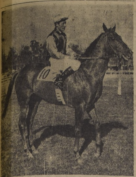
COMBATIENTE, el excelente hijo de Talit y Campanillera que a juicio de muchos, el presunto crack de la generación, y que ha a la "Polla de Potrillos" dispuesto a consagrarse definitivamente.

VIVO INTERES HA DESPERTADO EL COTEJO DE LOS PRESUNTOS CRACKS DE LA GENERACION EN LOS 1.700 METROS DE ESTA IMPORTANTE CARRERA QUE PERMITIRA AQUILATAR LOS VERDADEROS MERITOS DE CADA CUAL.—DINAMICO, BARBAROSSA Y HUARACULEN TIENEN TITULO PARA PELEAR LA RECOMPENSA ASIGNADA AL VENCEDOR