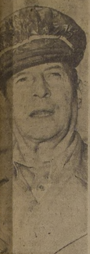
Esta es la más reciente fotografía del general MacArthur, a quien el presidente Truman pidió esta tarde que retirara su declaración sobre Formosa, porque habría confusión con respecto a la política de Washington a dicho baluarte. China nacionalista. El MacArthur decía que conveniencia de que una amiga era vital para la seguridad de los Estados Unidos.

EN POHANG, LOS NORCOREANOS SE ESTAN RETIRANDO