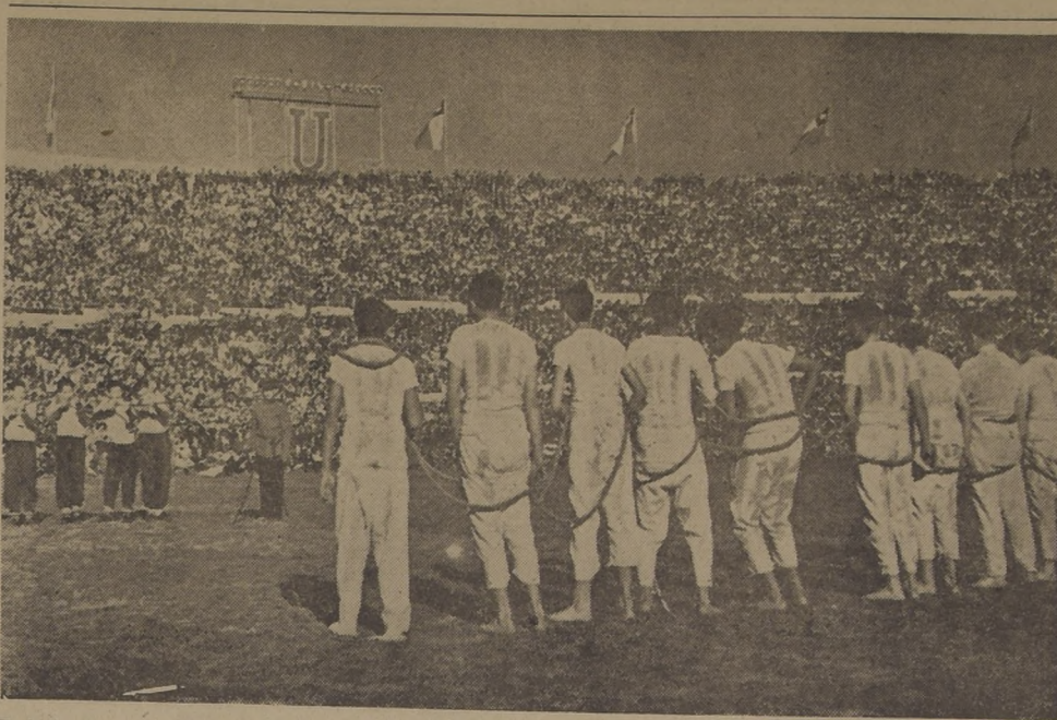
El fusilamiento del "Tucho" Caldera? No. Aquí están matando a varios de una vez... Parece que los que disparan son de la Católica, y los que "van a morir", de la "U". Corresponde este instante trágico a un "CLASICO" UNIVERSITARIO de hace dos años. Para el de mañana, donde se han preparado números más novedosos que nunca, el entusiasmo de la gente es extraordinario. Los que puedan conseguir entrada, que se vayan muy temprano al Estadio Nacional, y los otros, bueno, que escuchen la gran fiesta por radio...