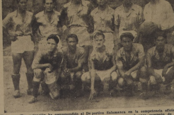
Una magnífica actuación ha correspondido al Deportivo Salamanca en la competencia oficial de fútbol del presente año.