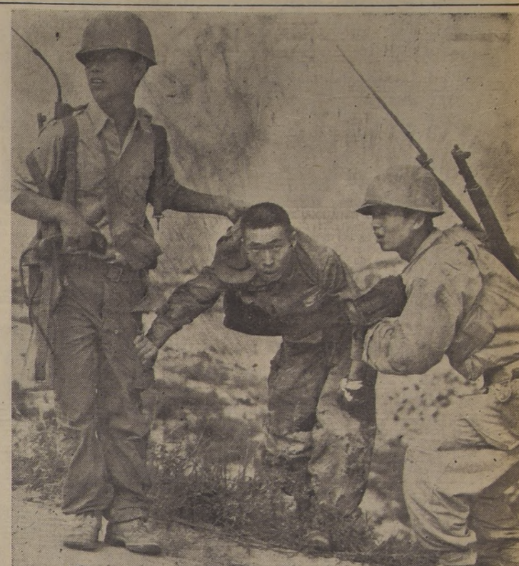
ASI SE LUCHA EN COREA.—EN SUR DE COREA.— Dos soldados surcoreanos extraen de entre las malezas a un asustado soldado comunista de Corea del Norte en el frente de Pohang, donde han sido sorprendidos numerosos franco-tiradores enemigos de las fuerzas de las Naciones Unidas.