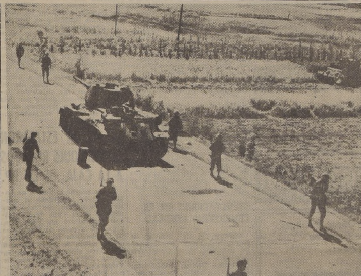
EN EL CAMINO HACIA SEUL. — Soldados de marina norteamericanos pasan por los costados de un tanque soviético incendiado, cuya tripulación rusa inutilizó por los norteamericanos en sus ataques. Se ve también otro tanque de fabricación rusa inutilizado por los norteamericanos en sus ataques. (Foto ACME).

CIERRA BOLSON QUE ATRAPARA A CIN MIL ROJOS WASHINGTON, 25. (U. P.).— El portavoz militar dijo que el general Mac Arthur ha informado que los elementos de avanzada de la séptima división de infantería y la primera división de caballería están ahora separadas sólo por una distancia de 61 kilómetros, en su avance para entrar en la zona de Incheon-Seul con las fuerzas de caballería de playa. El portavoz dijo que no se puede predecir cuándo se unirán las dos fuerzas, porque "están moviéndose tan rápidamente que no podemos indicarle en el mapa dónde se encuentran en la actualidad". La primera división de caballería avanza hacia el norte desde la cabecera de playa de Pusan. El portavoz dijo que los comunistas en la zona de la cabecera de playa siguen oponiendo una fuerte resistencia al avance de Songju, que no puede ser mirada en menos". El portavoz naval informó que el general al mando de la quinta división surcoreana ha sido apresado, pero no pudo identificarlo por su nombre.