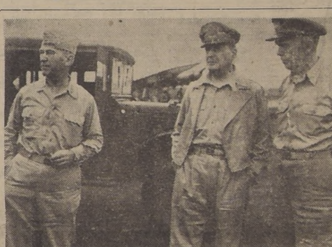
El General George C. Marshall, actual Secretario de Defensa de los Estados Unidos, aparece en esta fotografía acompañado del General Douglas Mac Arthur, Comandante en Jefe de las Fuerzas Aliadas en el Pacífico Sur, y el Teniente General Walter C. Krueger, Comandante del Sexto Ejército Norteamericano. Los tres se encontraban entonces en las oficinas de Mac Arthur, durante la Segunda Guerra Mundial.

TOKIO, martes 26 (UP).— URGENTE. — Un comunicado de las Naciones Unidas anuncia la caída de Seul. El comunicado es el siguiente: "Seul, capital de la República de Corea, está otra vez en las manos amigas de las fuerzas de la NU, incluyendo el Décimo séptimo regimiento del ejército de la República coreana y unidades de las divisiones Séptima del ejército de EE. UU. y Primera de la Infantería de Marina, que han completado el cerco y la toma de la ciudad".