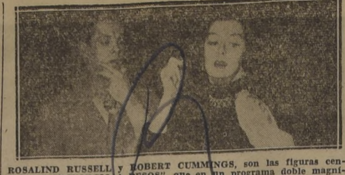
ROSALIND RUSSELL y ROBERT CUMMINGS, son las figuras centrales de "DIVORCIO A BESOS", que en un programa doble magnífico, presenta desde hoy Columbia Pictures, en el Normandie, junto con "LA CALLE SIN SOL", protagonizada por Amparito Rivelles y Antonio Villar.

AUDICIONES DESDE RADIOS ITALIANAS. Se informa que las emisiones de la Radio Italiana (R. A. I.), especialmente destinadas a los oyentes sudamericanos, se efectúan todos los días, con el programa siguiente: