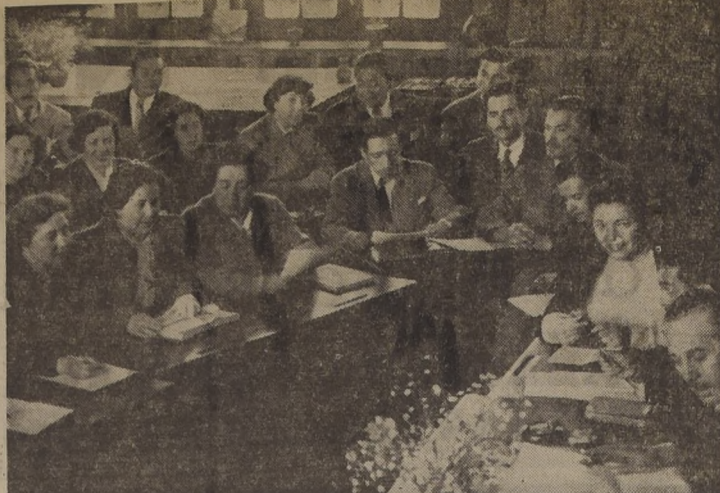
Jornadas Pedagógicas celebran 400 maestros. La Comisión de Principios Doctrinarios y Método de Investigación Científica...