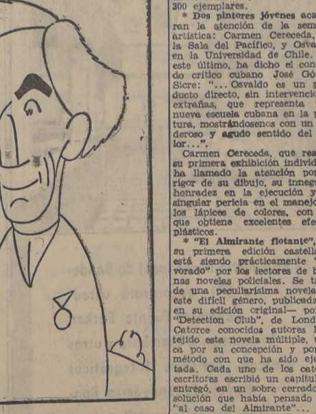
El filósofo inglés Bertrand Russell, que ha constituido, con B. Croce y Maritain, un grupo de grandes sabios e intelectuales, contra toda clase de totalitarismo.