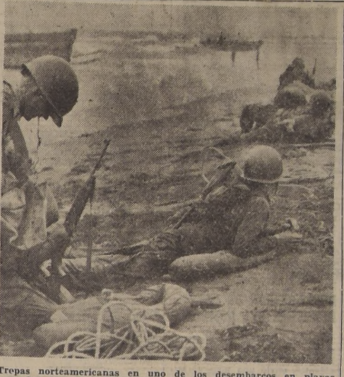
Tropas norteamericanas en uno de los desembarcos en playas ocupadas por los rojos, inician el avance bajo el fuego de los soldados comunistas, que han defendido encarnizadamente sus posiciones. — (Foto ACME).