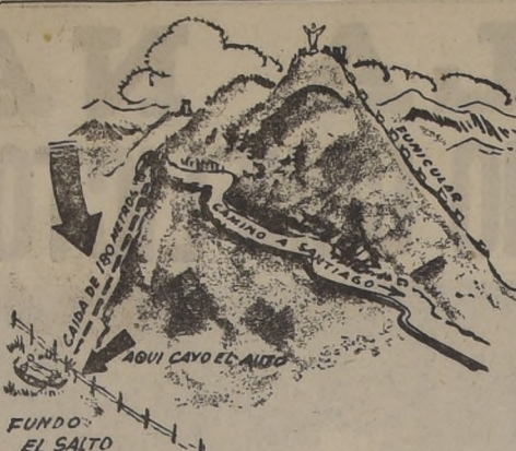
EL VIAJE HACIA LA MUERTE.—Este croquis muestra la dramática caída que sufrió ayer el Chevrolet del ingeniero alemán en una ladera del cerro San Cristóbal. El dramático accidente, que costó la vida a dos personas, ocurrió a las 17.15 horas, y solo una campesina lo vio.