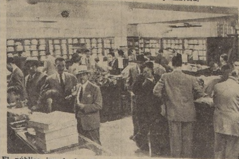
El público invade los departamentos de Camisería y Zapatería.