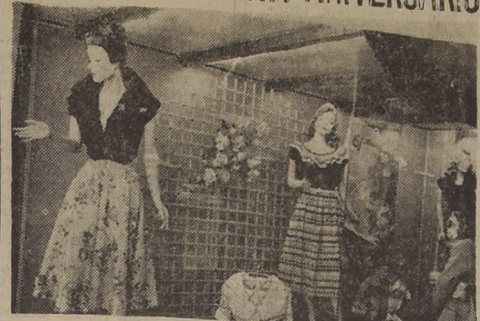
Una de las vitrinas de la Sección Modas de Falabella, en la cual se exhiben hermosos trajes de primavera.

La firma puede mantenerse en los últimos años, de cuantiosos, proveerse miles de artículos de las fábricas más modernas de Europa, Canadá, Estados Unidos, Brasil, Argentina y del país. Ha tenido talleres que montan trajes de confección a la medida, en todos sus departamentos. Este acontecimiento metropolitano, que se une a la llegada de la primavera, de tanta alegría para todos, constituye igualmente una satisfacción para los hogares poderosos y humildes, porque pueden adquirir mercaderías a bajos precios en estos tiempos de aguda crisis económica.