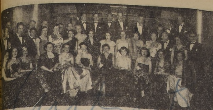
Comida ofrecida por la Asociación de Diplomáticos, en los salones de los Establecimientos Waldorf.

que comienzan a destacarse en el ambiente artístico de Chile. Las entradas, en número limitado, se han vendido casi en su totalidad, pues el público ha cooperado en esta labor de tan alto significado social.