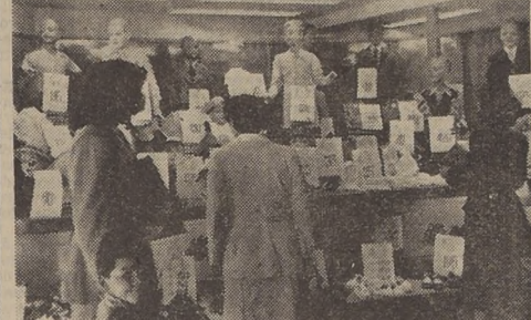
La Sección Niños, como siempre, ofrece mercaderías a bajos precios.

co, en corte y confección, de reconocidos méritos profesionales. Gracias a este extraordinario esfuerzo y espíritu de superación, Falabella ha podido descolarse en el ramo de su especialidad, y satisfacer cumplidamente los caprichos más exigentes de su gran clientela de la capital y de provincias.