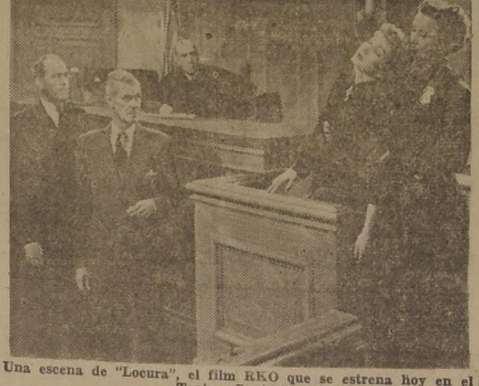
Una escena de "Locura", el film RKO que se estrena hoy en el Teatro Central.

INTERESANTE FONDO PSICOLOGICO DEL FILM "LOCURA" QUE IRA HOY