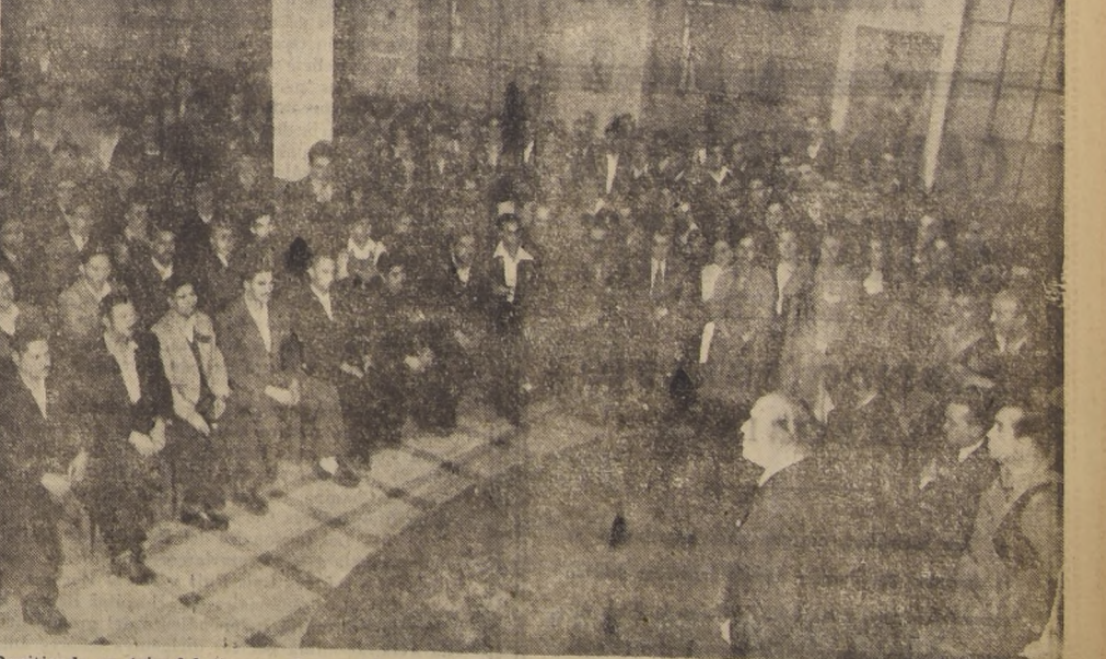
Repetiendo su triunfal jira por los pueblos del 2.º, 3.º y 4.º Distritos de Santiago, el candidato de la oposición, señor Matte Larrain ha recibido estos últimos días la entusiasta adhesión del pueblo de Santiago. Manos curtidadas con la diaria labor han estrechado al candidato con sinceridad manifiesta. En su visita al Matadero, los trabajadores de este establecimiento suspendieron sus faenas para recibirlo en un acto emotivo y promisorio. Los dos fotos superiores muestran algo de lo que fué esa manifestación. La foto tercera muestra a los ciudadanos de Quinta Normal la noche en que fué proclamado el abanderado del trabajo en esa populosa comuna. Y la foto de abajo muestra al señor Matte acompañado del presidente del Sindicato Yarur, en los momentos en que agradece la adhesión de ese importante centro gremial. La candidatura Matte ha sido recibida en forma delirante por el pueblo.