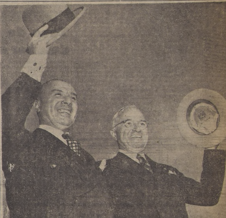
El Excmo. señor González Videla y el Presidente Truman, durante la visita que el Mandatario chileno realizó a Estados Unidos, cuyos efectos se palparán ahora, al anunciarse que Norte América pondrá en práctica su colaboración para hacer realidad el Punto Cuarto del Plan Truman. — La Cancillería chilena anunció el envío de misiones técnicas para lograr el progreso de las diversas actividades nacionales.

El Excmo. señor González Videla expresó a la prensa que esta ayuda efectiva que la gran nación americana presta a Chile para el desarrollo de su economía, y para la resolución de problemas de tanta trascendencia como son los relativos a la educación y las habitaciones para el pue-