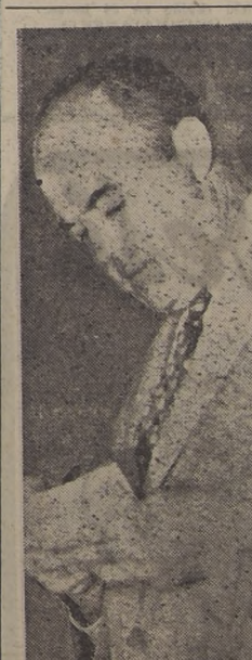
Rollin Atwood, funcionario del Departamento de Estado de Estados Unidos, que recientemente visitó nuestro país y que elevó un muy favorable informe sobre Chile.