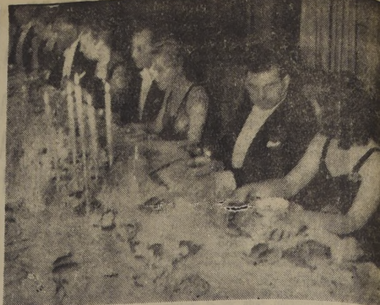
EN HONOR DEL MINISTRO DE RELACIONES EXTERIORES Y SEÑORAS ASISTENTES A LA COMIDA OFRECIDA POR EL EMBAJADOR DE MÉXICO, Y SEÑORAS ASISTENTES A LA COMIDA OFRECIDA POR EL EMBAJADOR DE MÉXICO, EN HONOR DEL MINISTRO DE RELACIONES EXTERIORES, Y SEÑORA DE WALKER.