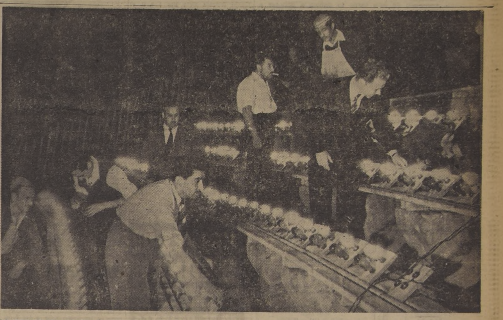
LO TOMAN EN SERIO.—El aspecto risa, optimismo y chascarrío, desaparece cuando se está trabajando. Y la preparación del "clásico" universitario...