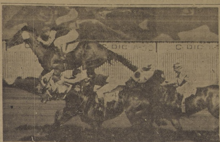
El mejor dividendo de la tarde se produjo en la quinta carrera, que correspondía a la mejor serie de los handicaps de velocidad. La victoria la obtuvo Horos, por medio pescuzejo sobre Agallido y Cambises, que llegaron separados por media cabeza. La hija de Afghan subrayó su triunfo con un sport de $ 228 por boleto.

El tercer lugar a dos y medio cuerpos lo obtuvo Tolón en avance final delante de Moriche y Talento que empataron el cuarto lugar. Último Penáscal.