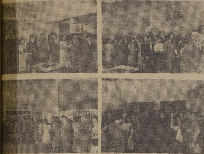
Público que se dió cita ayer en el Teatro Principal para las exhibiciones de "DESGRACIADAS" o Educación Sexual.

Un espectacular triunfo obtuvo "DESGRACIADAS" o Educación Sexual, en sus funciones de estreno de ayer en el Teatro Principal. Durante el día, la escuela y cómica sala de la casa. El público se retiró ampliamente satisfecho del Teatro Principal, y muchos estuvieron conformes en declarar que "se trata del film más audaz y valiente que se ha exhibido en los teatros de Santiago".