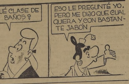
ESO LE PREGUNTÉ YO, PERO ME DIJO QUE CUAL QUERA Y CON BASTANTE JABÓN