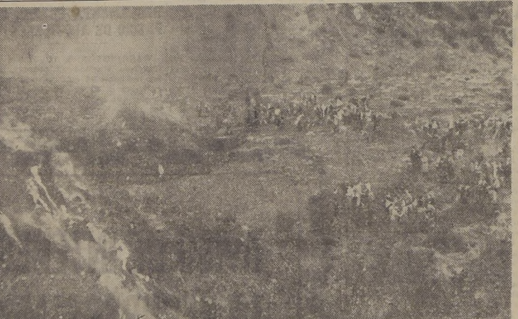
MILÓ, SICILIA.— Los habitantes de la aldea siciliana de Miló, cercana al famoso Volcán Etna, se reúnen en el valle para observar el descenso de la lava después de una semana de violentas erupciones, las cuales habrían sido las más serias de 21 años a la fecha. Los aldeanos realizaron una procesion en honor de San Andrés, el Santo Patrono de ellos, para pedirle que contuviera los ríos de lava, que destruyeron todo a su paso.