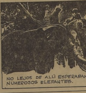
NO LEJOS DE ALLÍ ESPERABAN NUMEROSOS ELEFANTES.