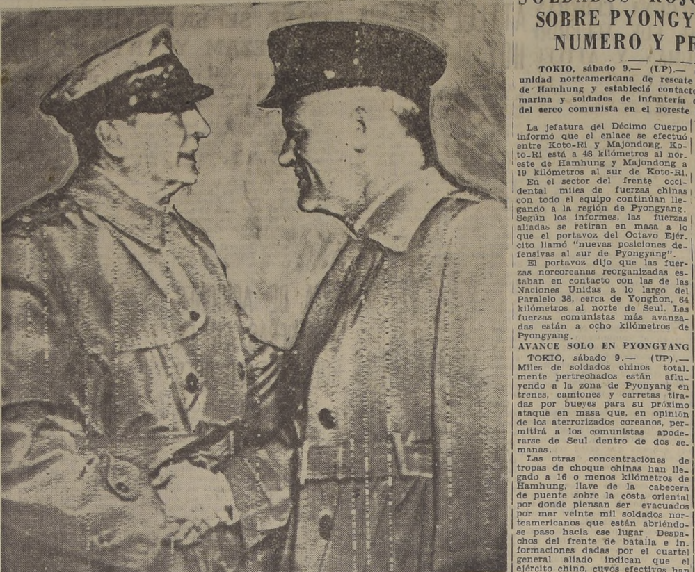
URGENTE ENTREVISTA MILITAR EN TOKIO.—TOKIO.— El general Douglas Mac Arthur (izquierda) saluda al general L. Lawton Collins, jefe del Estado Mayor General del Ejército Norteamericano a su llegada al aeródromo de Tokio para una urgente conferencia militar sobre la grave situación en Corea.

Agregó que no cree que Gran Bretaña haya hecho una contribución adecuada de hombres a la lucha de Corea y criticó el hecho de que la China roja recibía materiales diversos por el puerto de Hong Kong. "Creeo que los comerciantes británicos no quieren tomar disposiciones energéticas contra el comunismo. Hong Kong es una especie de rehén para ellos". Aclaró que no incluye en este cargo al Gobierno británico.