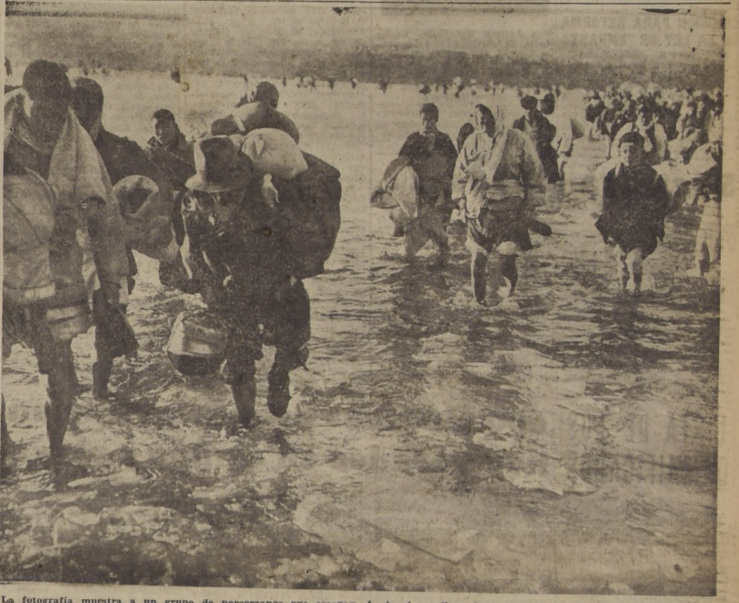
La fotografía muestra a un grupo de norcoreanos que escapan hacia el sur llevando lo poco que pueden cargar en su escape de las hordas comunistas chinas. Hombres, mujeres y niños atraviesan el helado río Taedong, cerca de Fyongyang.

TOKIO, miércoles 3. — (U. P.). — (Hobrecht). — Las tropas invasoras comunistas chinas llegaron a sólo 22 kilómetros de Seul el martes por la noche, persiguiendo de cerca a las fuerzas del Octavo Ejército norteamericano, que se baten en retirada, mientras otras unidades rojas que atacan cerca de la costa oriental abrieron una brecha en el flanco del Ejército de las Naciones Unidas.