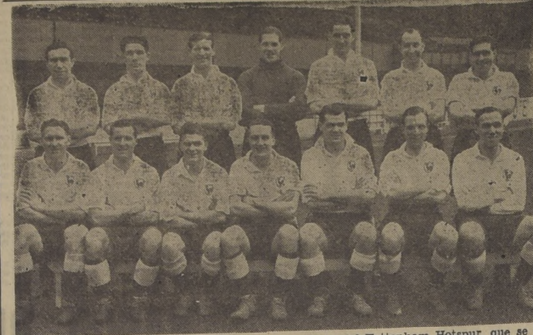
EL TERROR DE LOS GRANDES.— Este es el conjunto del Tottenham Hotspur, que se ha convertido en el rival más peligroso de los consagrados del fútbol británico. Después de haber ganado durante 15 temporadas por ascender a la serie de honor, consiguió por fin, su objetivo, y en 1950 ha realizado una campaña realmente brillante.