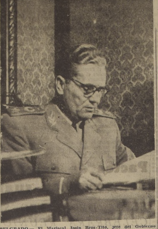
BEGRADO.— El Mariscal Josip Broz-Tito, jefe del Gobierno comunista yugoslavo, en su despacho. El Mariscal Tito, jefe del Gobierno comunista yugoslavo, en su despacho.