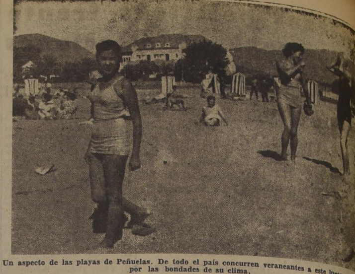
Un aspecto de las playas de Peñuelas. De todo el país concurren veraneantes a este lugar, atraídos por las bondades de su clima.

La Administración de Talcahuano, jefe de la oficina local ha dado instrucciones para que se continúe el anteproyecto definitivo, para continuar con los demás estudios y hacer realidad, cuanto antes este anhelo.