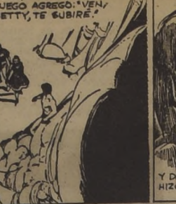
¡¡¡¡¡ LA ROCA FORMA UN BORDE Y HAY UN PROFUNDO TUNEL... ¡¡¡¡¡