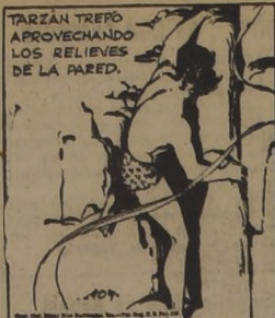
TARZAN TIENE APROXIMANDO LOS RELIEVES DE LA PARED.

COMPRAMOS: joyas, brillantes, bolsos, empuño, objetos arte, marcos preciosos. Superamos ofertas. Alameda 85, esquina Nueva York. 9-F