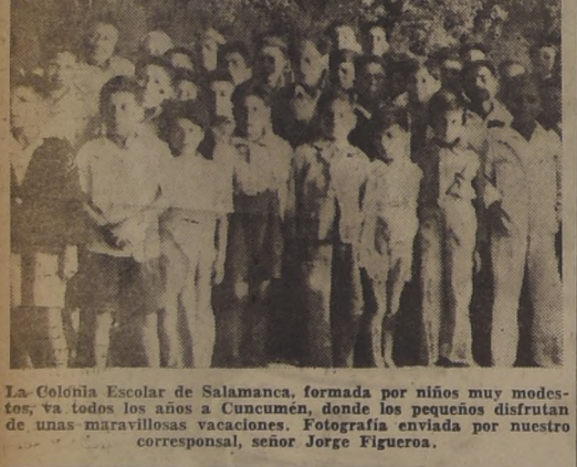
La Colonia Escolar de Salamanca, formada por niños muy modestos, va todos los años a Cuncumén, donde los pequeños disfrutan de unas maravillosas vacaciones. Fotografía enviada por nuestro corresponsal, señor Jorge Figueroa.

Después de luchar tantos años, y con tan ingentes sacrificios por la anhelada construcción de esta obra para terminar la interrupción del tránsito entre esta Villa y sus alrededores con Melipilla, se presentaría el caso curioso de tener un puente sin caminos accesibles a él, y a su vez, el antiguo camino, sin puente, y con vados imposibles de cruzar en épocas de invierno, cuando por persistentes lluvias vienen creces que hacen subir de manera apreciable el nivel de las aguas y aumentar el torrente de este estero. (JIMENEZ, Corresponsal).