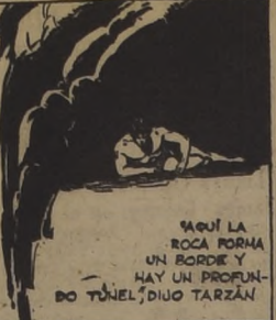
¡¡¡¡¡ LA ROCA FORMA UN BORDE Y HAY UN PROFUNDO TUNEL... ¡¡¡¡¡