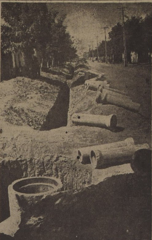
OBRAS DE ALCANTARILLADO.—Estado de los trabajos de alcantarillado de la calle Constantino de la Comuna de Quinta Normal. En primer plano puede verse una de las matrices de esas obras. En segundo plano, los tubos de los nuevos servicios que quedarán terminados a corto plazo. Los trabajos se llevan a un ritmo acelerado, lo que permitirá a esta progresista comuna contar con estos servicios esenciales para la salubridad de la población.