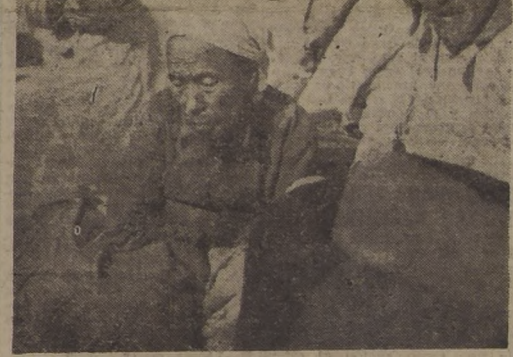
COREA DEL SUR. — Dos ancianos surcoreanos huyen hacia la parte meridional de Corea por segunda vez y hacen un descanso antes de continuar la pesada marcha en medio de un frío intenso. — (Foto ACME).

SAN FRANCISCO, 2 (U. P.) — El servicio de Guardacosta dijo que el objeto brillante que pasó por el cielo de California y que asombró a millares de ciudadanos, al parecer fué un meteorito. La estación de coordinación de aire y mar, del servicio mencionado, dijo que las llamadas telefónicas se recibieron hasta de puntos tan lejanos como Moro Bay, cerca de San Luis Obispo, por el sur, y hasta de la frontera norte del Estado de Oregón. Se dijo que un informe, que decía que el fenómeno fué visible hasta en Seattle, Estado de Washington, no ha sido confirmado. El objeto fué descrito como de color verde rojizo y con algo de color azul, y que se vió durante 36 segundos mientras viajaba a gran velocidad en una dirección horizontal hacia el Oeste. Dentro de su rapidez, parece que el objeto después cayó verticalmente y tocó tierra en medio de un relámpago brillante y desapareció. El Servicio de Guardacosta informó que los pilotos de algunos aviones vieron el objeto brillante 150 millas en alta mar.