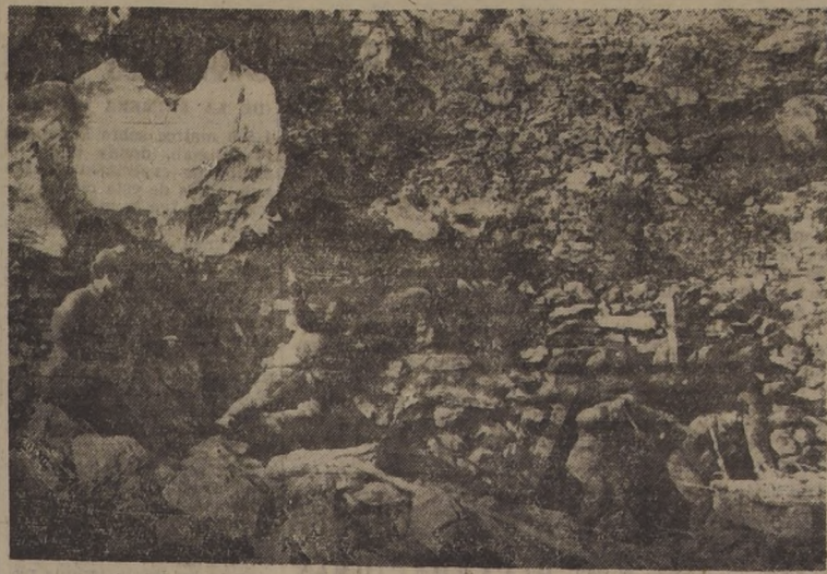
EN UN LUGAR DE COREA.—Soldados de la China comunista que luchan en Corea surcoreana en un refugio a unos soldados norteamericanos y los hacen prisioneros, según versión de esta fotografía de origen soviético.

HONGKONG, 2 (UP).—Informaciones procedentes de la provincia de Kwangsi dan cuenta de que se está librando una lucha en gran escala contra los guerrilleros, cerca de la frontera con Indochina, donde 100 mil soldados comunistas están tratando de consolidar sus posiciones, evidentemente como preparativo para futuras operaciones.