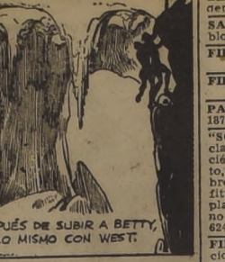
¡¡¡¡¡ LA ROCA FORMA UN BORDE Y HAY UN PROFUNDO TUNEL... ¡¡¡¡¡