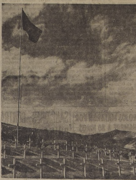
LAS PALABRAS DE LINCOLN INSPIRAN AL MUNDO.—"He venido a dedicar una porción de este terreno como sitio de descanso final para aquellos que dieron sus vidas". Nuevas cruces marcan hoy nuevas tumbas de los soldados de las Naciones Unidas que dieron sus vidas por la causa de la libertad. La fotografía muestra un cementerio militar cerca de Pusán, en la República de Corea.

PRAGA, 9.—(U. P.)— El periódico "Lidove Noviny" dice que el alcoholismo está poniendo en peligro el plan quinquenal checoslovaco. Agrega que el alcoholismo es más que ningún otro factor, el responsable de que la economía nacional sufra pérdidas por valor de millones de coronas. Explica más adelante que Ostrava, el más importante centro industrial y carbonero del país, es el mayor consumidor de bebidas alcohólicas.