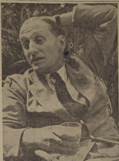
ORIGINAL EXPRESION.—Lord Burghley, el ex atleta británico, aristócrata de cepa, es un hombre amable, atento, jovial y sin prejuicios.