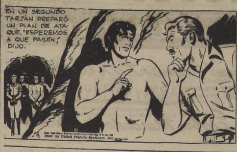
LOS DOS HOMBRES AGUARDARON EN SILENCIO.