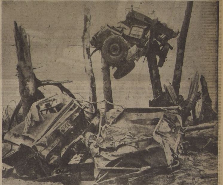
ESTA ES OBRA DE LA MADRE NATURALEZA Y NO DEL PINTOR DALL.— Mount Lamington, Nueva Guinea.— La lava que cubrió estos vehículos ha dejado una muestra de su acción violenta contra las cosas cuando se derritió. Esta lava provino del volcán Lamington, que estalló en erupciones por varios cráteres, en la zona de Higaturu, de Papua, Nueva Guinea. Las erupciones mataron a más de 4.000 nativos y 35 europeos. Miles de personas resultaron heridas. El Gobierno australiano otorgó inmediatamente un subsidio de 50.000 dólares para socorrer a los damnificados de esta isla.— (Foto A.G.M.E.)