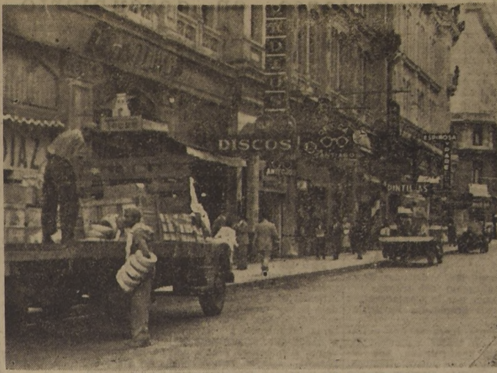
BURLAN ESTACIONAMIENTOS PROHIBIDOS EN EL CENTRO.—Carabineros y los inspectores municipales se olvidaron totalmente de la fiscalización de los estacionamientos prohibidos. Ninguna de las disposiciones que rigen al respecto se cumplen, y los camiones y automóviles se detienen en las calles centrales, justamente al lado de los rótulos que indican con claro lenguaje: "No estacionar a este costado". El grabado lo demuestra elocuentemente: en la calle Ahumada, primera cuadra, el camión FS-577, de Santiago, y el XB-307, de Conchalí, y un "jeep", estuvieron instalados tranquilamente desde las 17 hasta las 20 horas.

El grupo de médicos chilenos que actualmente se encuentra en Valdivia, regresará en el curso de la semana próxima a Santiago, para iniciar los trabajos de investigaciones en los laboratorios de la Dirección General de Sanidad, y emitir los informes respectivos a las autoridades sanitarias de las regiones sureñas afectadas, a fin de que impartan instrucciones en el sentido de cómo debe comportarse el consumidor al consumir las truchas y salmones de agua dulce, especies que están siendo atacadas por el "Botriocéfalo".