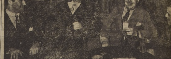
PERIODISTAS AMERICANOS EN CHILE. — Aquí están tres de los cuatro periodistas norteamericanos que visitan Chile...