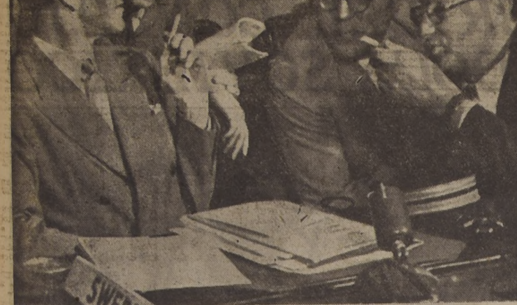
Cambian amables impresiones al comienzo de la sesión del Consejo Económico de las Naciones Unidas...

«Efectuamos cinco allanamientos en fundos y parcelas de Quilicura...»