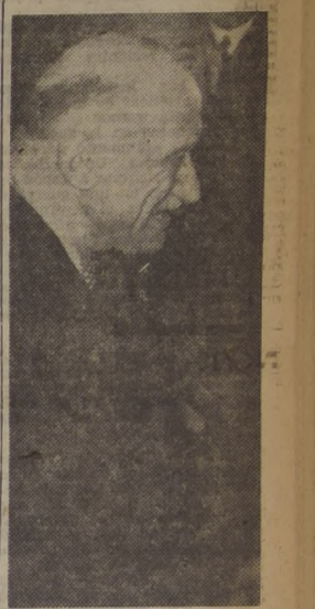
R. Schuman; autor del plan acerca del carbón y acero de Europa, amenazado ahora a causa de la oposición alemana.

Los representantes de Francia en las negociaciones sobre el Plan Schuman, dicen que ellos han hecho “grandes concesiones” a los alemanes en muchas cuestiones.