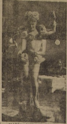
MARIA ANTONIETA PONS

El martes próximo subirá al escenario del Teatro Santiago el film titulado "Un cuerpo de mujer", apasionante historia de amor intenso, que animan con extraordinaria propiedad Maria Antonieta Pons y Eduardo Norega, dentro de un reparto de primeras figuras del cine mexicano. Es Maria Antonieta Pons quien en este film se lleva las palmas del éxito. Aparte de su sensual baile que destaca con arte y elegancia la actriz se revela como un elemento de relevantes condiciones interpretativas.