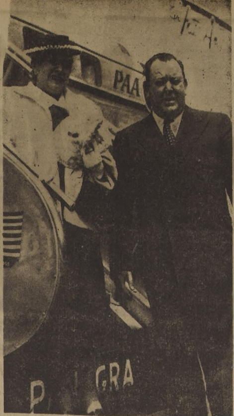
TRYGVE LIE SE DIRIGIO ATER A LIMA