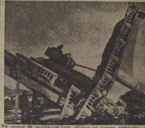
Un tanque de fabricación rusa terminó su carrera combativa al derribarse un puente en Corea, a causa de las bombas lanzadas por aviones de las Naciones Unidas.— (The Illustrated London News).

PUERTO ESPAÑA (Trinidad) 26 (U. P.).— La isla de Granada, a 100 millas al norte de Trinidad, se encontraba hoy en calma; pero en medio de una tensa situación por marineros e infantes de marina de la Marina Real, mantenía el orden después de una semana de reinado del terror, durante la cual cinco personas han sido heridas a balazos. Los incidentes aparentemente se debieron al arresto de dos dirigentes obreros, durante la huelga de trabajadores agrícolas no especializados. Patrullas de la fragata "Snipe" desembarcaron ayer para ayudar a la policía, y a los infantes de marina del "Devonshire", a mantener el orden. Las autoridades advirtieron a los turistas que debían abandonar la isla.