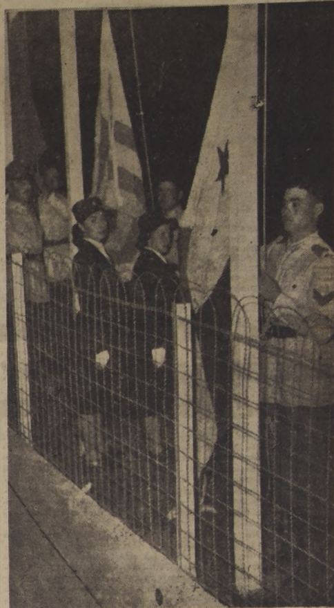
IZAN LAS BANDERAS DE LAS 21 NACIONES.— Buenos Aires.— Emocionante momento en que se izan las 21 banderas de los 21 países participantes en los Primeros Juegos Olímpicos Panamericanos, inaugurados la noche del domingo en Buenos Aires, en presencia del Presidente de la República Argentina.— (Foto ACME).

El mismo sábado se dirigirá a Villa del Mar, para saludar a S. E. el Presidente de la República y el lunes regresará a Santiago para asistir a una reunión del Consejo Económico y Social de las Naciones Unidas.