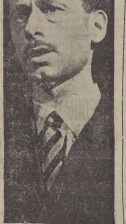
Barón Xavier Van Der Straten de Bélgica, presentó un proyecto de resolución, con el apoyo de Suecia, para entregar todas las acusaciones por violación de los derechos sindicales a conocimiento de la OIT (Organización Internacional del Trabajo).

El doctor Ahumada, señaló finalmente que la Comisión de Estupefacientes que irá a China a investigar la venta de 500 kilos de opio, no tendrá ningún carácter político, y que las Naciones Unidas habían actuado en forma seria al impedir que se cometiera un atentado en contra de la salud y bienestar mundial.