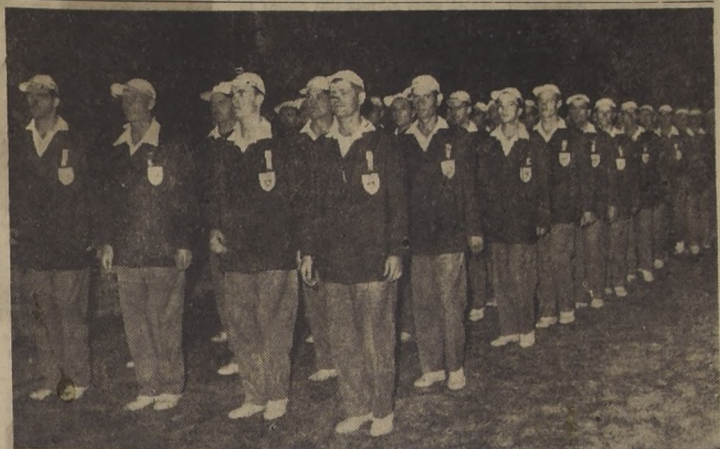
DESFILE EL EQUIPO CHILENO EN JUEGOS PANAMERICANOS.— La numerosa delegación que ha enviado Chile, desfila la noche de la inauguración de los Primeros Juegos Olímpicos Panamericanos en Buenos Aires la noche del domingo último.