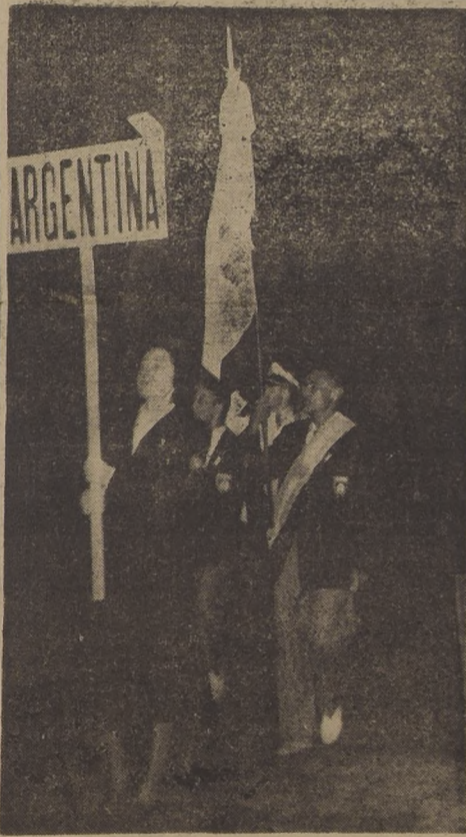
ESTANDARTE DE ARGENTINA. — Cerró el desfile inaugural de los Juegos Panamericanos, el numeroso conjunto del país organizador. Condujo el estandarte Delfo Cabrera, ganador olímpico de la maratón de Londres.