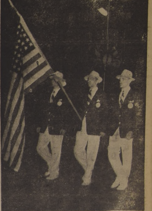
ABANDERADO DE EE. UU. — Pasa en estos momentos el abanderado del conjunto de Estados Unidos, con sus escoltas. El equipo norteamericano fué uno de los más numerosos, junto con Chile, Argentina y México.

Una molesta clátrica afecta a nuestro eficiente decatleta. Se le produjo ayer después de sus entrenamientos en saltos, siendo sometido de inmediato a un fuerte tratamiento por el doctor Félix Garay. Unas inyecciones ya colosadas y otros cuidados hacen posible que el atleta chileno llegue a su plena derecha, que le obligará a participar en las 10 pruebas, pero no en el salto largo. — FRITZ.