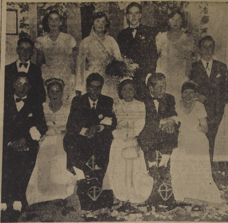
REINA DEL MUTUALISMO EN LA UNION.- Su Majestad Matilde I, rodeada de su Corte de Honor, que presidió las festividades mutualistas de esta ciudad. La gentil soberana prestó visitas a los enfermos del Hospital y a los reos de la Cárcel, llevándoles las simpatías de su juventud, y haciéndoles obsequios.