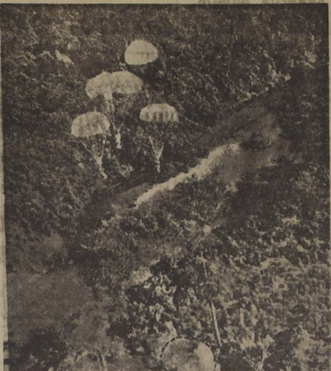
Aviones de la Real Fuerza Aérea de Gran Bretaña, dejan caer abastecimientos en un tropa de la selva del norte de Malaya, en donde se hallan operando las tropas británicas.— (The Illustrated London News).

Los correspondientes de la United Press dijeron que no hay señales de una fuga a la "desbandada" de que hablaba Almond.