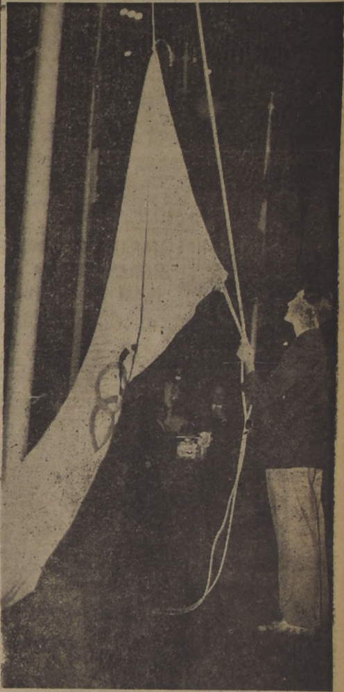
SE IZA LA BANDERA OLIMPICA. — Oscar Furlong, crack del básquetbol de Argentina, iza la bandera olímpica, en el acto inaugural de los Juegos, realizado el domingo en la noche en el Estadio de Racing.