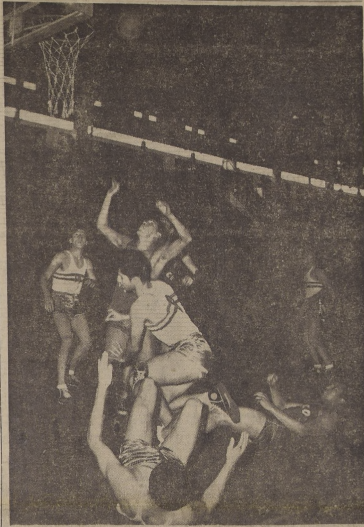
¿BASQUETBOL MODERNO? — Quizás sí será así el básquetbol moderno, pero lo cierto es que en la escena aparecen dos hombres en el suelo y otro que va cayendo. Es este un aspecto del match con los paraguayos ganaron a los mexicanos por 78 contra 51. Gran final será la que sostendrán norteamericanos y argentinos por el título de campeón panamericano de este deporte.

El Banco desea borrar todo malentendido con Chile, declaró Mr. E. Black a S. E.