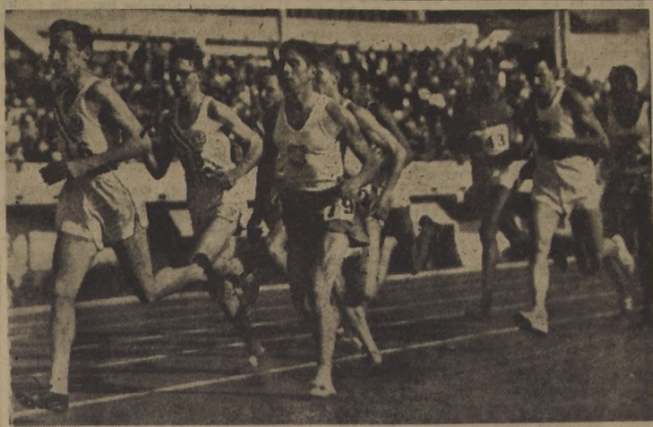
LA CONSAGRACION DE SOLA.— El chileno que lleva el N.º 79, está metido entre los primeros y se apronta para tomar posiciones en la final de los 1.500 metros...

Serios incidentes hubo en la final de los 1.500 mts.