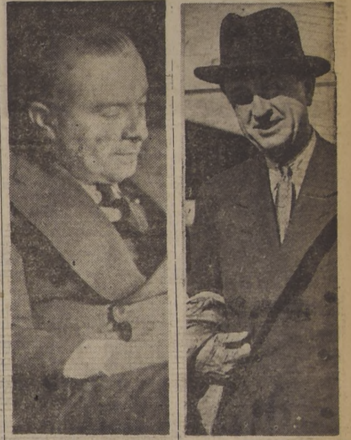
El Excmo. señor Gabriel González Videla, asumió una actitud energética frente a las reticencias con que el Banco Internacional consideró los planes industriales de Chile. Su alta posición pesó en el ánimo del Directorio del Banco. Mr. Eugene Black, Presidente del Banco Internacional, acogió los planes industriales de Chile, expresando que era el espíritu de la institución que dirigía, superar el malentendido surgido en las negociaciones con nuestro país.

El Banco Internacional aceptó anoche, en principio, financiar los planes de fomento que Chile tiene preparados, en una reunión de tres horas del Presidente de esa institución con el Primer Mandatario, el Ministro de Economía y el vicepresidente de la Corporación de Fomento de la Producción. Se acordó que el Banco daría suma urgencia al otorgamiento de un préstamo de diez millones de dólares para la mecanización de las minas de carbón, e impulsar el de dos millones para la construcción de la planta hidroeléctrica de Los Cipreses; diez millones para la fábrica de celulosa y para los planes de regadío en el norte y centro del país. Técnicos del Banco Internacional harán estudio conjunto con ingenieros chilenos sobre la situación de nuestra agricultura. El presidente del Banco afirmó a S. E., que deseaba "borrar todo malentendido entre el Banco y el Gobierno de Chile", y que "el espíritu es de cooperación franca y decidida".