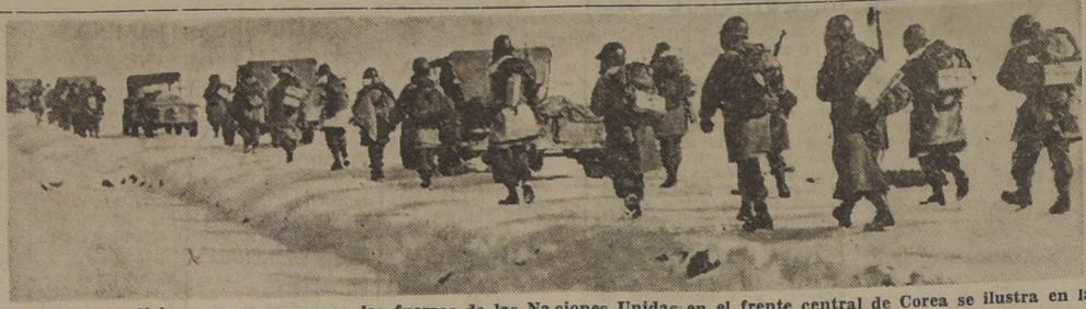
Las duras condiciones en que avanzan las fuerzas de las Naciones Unidas en el frente central de Corea se ilustra en la presente fotografía tomada en el sector de Seul.-(The Illustrated London News).