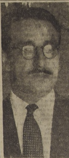
Don Gustavo Osorio Melo, Subsecretario de Salubridad, quien anunció a LA NACION, que el Gobierno creará el Servicio Nacional de Salud a base de los actuales servicios médicos existentes.