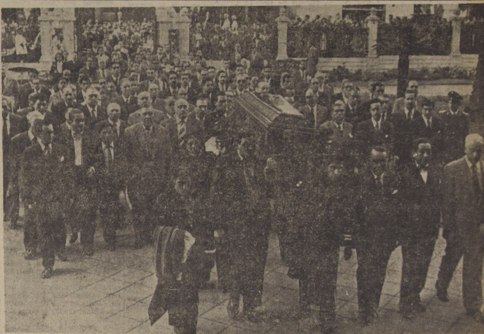
HOMENAJE A UN HOMBRE QUE DIO SU VIDA POR SERVIR A LA PATRIA.— Los más altos dirigentes políticos del país, casi todas las autoridades del Partido Radical de las organizaciones femeninas, de adultos y juveniles, concurren ayer, y lo harán también hoy, a las ceremonias realizadas en homenaje al que fuera por muchos años dirigente máximo del radicalismo, don Alfredo Rosende Verdugo, muerto en Italia, como Embajador de Chile, y cuyos restos llegaron a las 19 horas de ayer a esta capital. Hoy serán embarcados a Los Andes en donde se les dará sepultura.