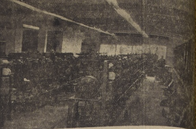
Una visita de las modernas instalaciones que posee la nueva industria AMERICAN SCREW (Chile) S. A.

CABALLEROS ABRIGOS TERNOS Y FINOS PARA SEÑORAS... SANTO DOMINGO 987-0F.15.