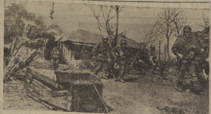
DANDO CAZA A LOS COMUNISTAS EN COREA DEL SUR.—Miembros de una patrulla de las fuerzas de las Naciones Unidas revisan cuidadosamente una aldea destruida en la ribera sur del río Han, a la vista de Seoul, buscando franco tiradores comunistas.

LAHORE (Pakistán), 9.—(U. P.)—El Primer Ministro, Liaquat Ali Khan, anunció la destitución del mayor general Akbar Khan, jefe del Estado Mayor del Ejército, y otros tres oficiales que han sido acusados de conspirar con los "enemigos" de Pakistán, con el objeto de causar desórdenes en el país por medio de actos de sabotaje y de subvertir la voluntad de las fuerzas de defensa.