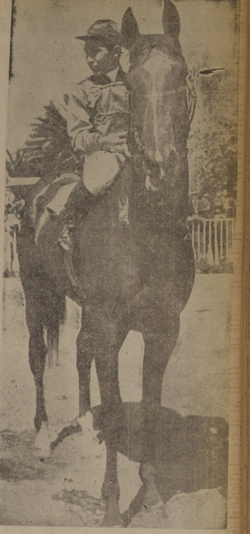
Con el prestigio de su breve y promisoría campaña cumplida en la pista del Sporting y del Hipódromo Chile, Comodor se perfila como el favorito y ganador del clásico Cotejo de Potrillos, que será corrido el domingo en nuestro principal circo de carreras. Su aplastante triunfo en el clásico "Pedro J. Medina" revela que hay pasta suficiente para esperar muchos triunfos del rápido hijo de Millstream.