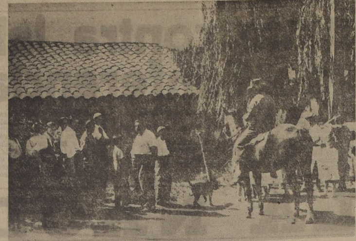
SITIO DEL TRAGICO SUCESO. Esta modesta casa de Peñaflores fue centro de toda la atención de los pobladores...