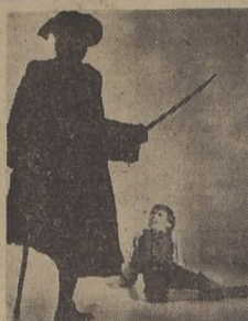
Un pirata con pata de palo y un joven grumete aparecen en "La Isla del Tesoro" producción telericador de Walt Disney.

gura producida por su enfermedad. Minelli y Judy se casaron en 1945. El divorcio actual — quizá previsto — no debe contar. Queda para ella los períodos en que logró ser feliz.