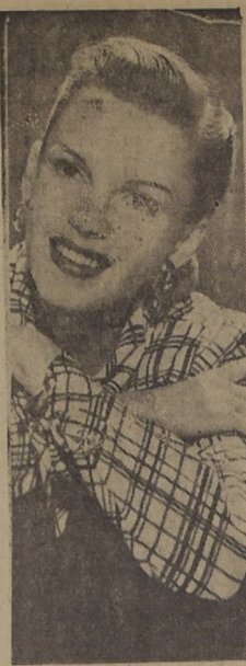
RUMORES ALARMANTES. — De Hollywood se han recibido nuevas y alarmantes noticias sobre la tormentosa vida de la joven y hermosa Judy Garland.

Y bien, ¿debió casarse Minelli, o quien fuera, con una muchacha así enferma, amargada, descontrolada y sufriendo más aún; pues, con su inteligencia se da cuenta de su triste situación? Si, una muchacha enamorada como lo estaba Judy al casarse con Minelli, merece todas las oportunidades no sólo para ser feliz sino también para intentar liberarse de sus pesadillas neuróticas, de la amar-