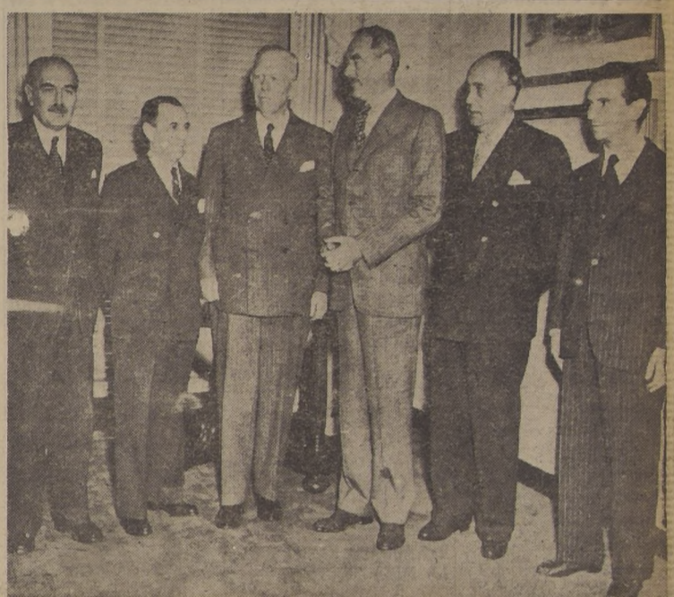
WASHINGTON.— El Secretario de Defensa de los Estados Unidos, General George C. Marshall (tercero de la izquierda) recibe en su despacho a cinco cancilleres americanos que asistieron a la Cuarta Reunión Consultiva de Ministros de Relaciones Exteriores de las repúblicas americanas. De izquierda a derecha: señor Horacio Walker, Canciller chileno; Joao Neves da Fontoura, Canciller brasileño; General George C. Marshall, Secretario de Defensa de EE. UU.; Dean Acheson, Secretario de Estado norteamericano; Pedro Zilveti Arce, Canciller de Bolivia, e Hipólito Jesús Paz, Canciller de la Argentina.

La resolución promete que todas las Repúblicas americanas se ayudarán entre sí “con vigor aún mayor” que en el pasado, en la ejecución de sus planes de fomento, y dice: “con tal fin las Repúblicas americanas suministrarán maquinaria, equipo mecánico y otros materiales necesarios al aumento de la capacidad productiva, facilitando cuando sea necesario la cooperación económica y técnica. La resolución determina que debe darse preferencia a los planes destinados a satisfacer los requerimientos básicos cíviles y los proyectos ya comenzados, cuya interrupción pudiera motivar pérdidas de materiales, dinero y esfuerzo. Otro artículo de la resolución, dice: “cada estado americano”.