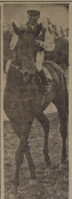
Empire se alista para el clásico "Presidente de la República"

Sobre 1.500 metros, las series handicap ofrecen, como siempre, toda suerte de dificultades para elegir al probable ganador. De todos modos, le ponemos el hombro a la aventura y tratamos de encontrar a los favoritos. PRIMERA CARRERA. — 8.a serie.— SOROLENCIA , 57 (B. Sandoval).— En anterior fase de su campaña anduvo bastante bien y como el lote no puede ser más infame, vale la pena tenerla presente. BALAYON , 54 (A. Quinío).— En Viña lo ha hecho discretamente. FICHA , 54 (J. Escobar).— Cuarta en la de Pitado. No es mucho, pero algo significa en tan precaria compañía. LUCAYA , 54 (M. Valenzuela).— Corriendo con mala suerte, la pequeña, de repente saltará con algo morrocotudo. TONY BOY , 53 (D. Andrea).— Lo creían hijo del domingo y ahora, ¿saldrá ahora? VIRAZON , 53 (G. Guajardo).— Cuarta en la de Julieta. Por esa actuación hay que sacarle el sombrero. SEXTA CARRERA. — 7.a serie handicap.— BABIECA , 59 (G. Sepúlveda).— Un tercero de Sagar le da cierta opción en este lote. RETOÑO , 58 (G. Retamal).— El doctor de San Diego abalora en encontrar la receta precisa para el hijo de Full Sail. El otro día arremetía como rumba en pos de Pitado, al que gana en un franco más... ENRAMADA , 54 (J. Guajardo).— Excelentes referencias tenemos acerca de esta hembra. No olvidarla, recomendamos. EL GALO , 53 (H. Vargas).— Desde los tiempos que dejó el corral de Quirós no ha levantado cabeza. Vale la pena, si tener en cuenta que estas series