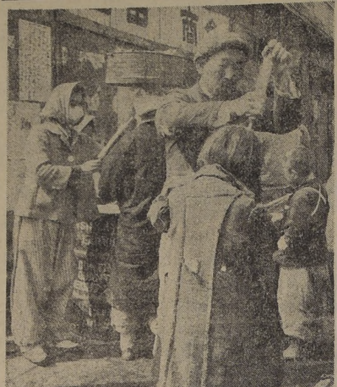
COMBATIENDO LA EPIDEMIA DEL TIFUS EN SEUL, COREA. — Funcionarios de salubridad de la capital de Corea del Sur preparan D. D. T. sobre ropas y cabezas de los residentes de Seul para impedir la propagación del tifus después de la nueva ocupación de esta ciudad por las tropas democráticas aliadas.