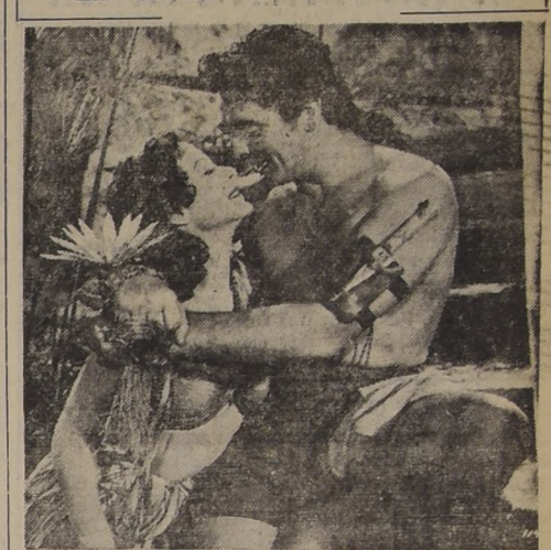
Medy Lamarr y Victor Mature en una escena de "Sanson y Dalila", de la Paramount.