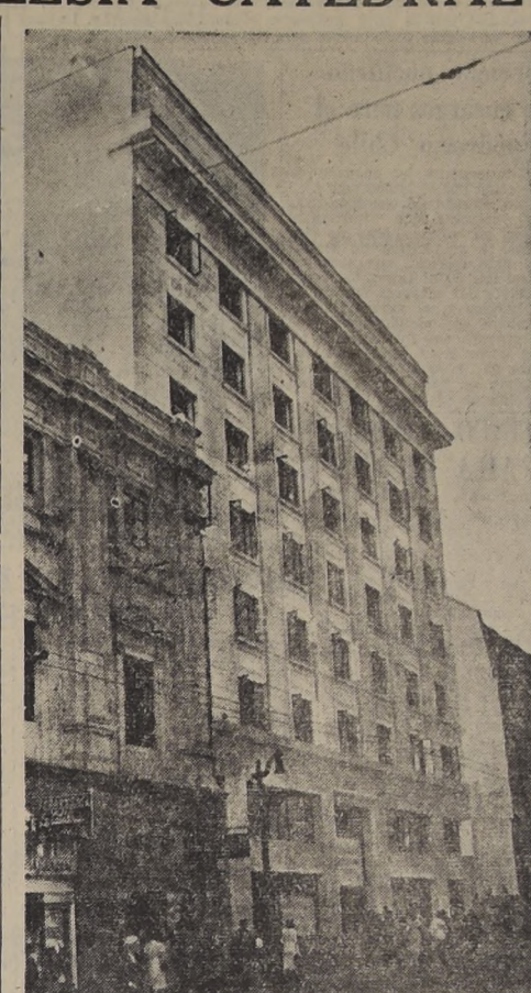
En la mitad de la cuadra de la calle Catedral, entre Puente y Bandera, se alza esta nueva construcción, de propiedad del Arzobispado de Santiago.

El fierro y el cemento lo suministró la firma Pascal y Cia. S. A. C., Huérfanos 979. Esta misma organización colocó todos los parquetes del edificio. Los estucos y decoraciones fueron ejecutados por la prestigiosa firma A. Berenguer y Cia. Ltda., Compañía 1068, oficina 900. En el ramo de cerrajería artística hizo un acabado trabajo la firma Mantelli Hnos., Argomedo 322. La fabricación de puertas y ventanas de madera fue encomendada al señor Martín Concha, Lira 2400. El servicio de calefacción central fue instalado por la firma Assler y Cia. Finalmente, entre otros diversos subcontratistas, figuró también el señor Miguel Rodríguez, quien ejecutó la pintura del edificio.