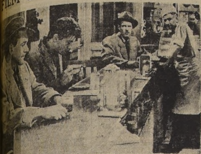
Mary y Victor Mature en una escena de "Destino me condena". Interesante hay en el "Destino me condena".