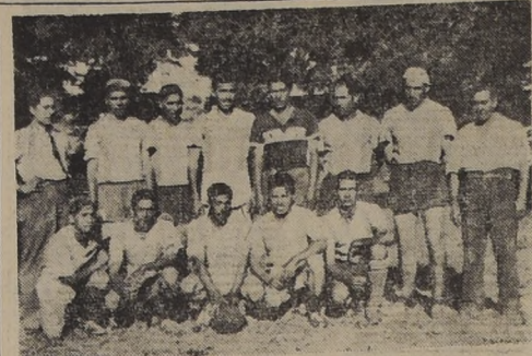
FUTBOL EN PAINE. — Equipo del Club Deportivo Primavera de Paine, quien tiene la primera opción para clasificarse campeón local...