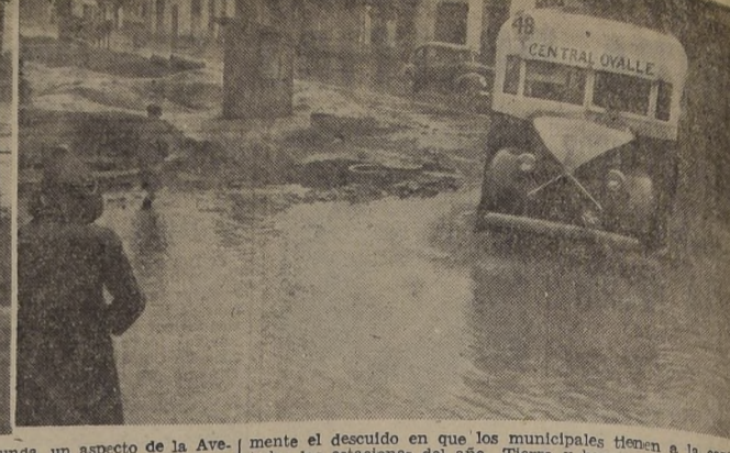
mente el descuido en que los municipales tienen a la capital en todas las estaciones del año. Tierra y barro en verano, agua y barro en tiempos de lluvia. (Información de G. E. P. y fotos de J. Pérez Soto).