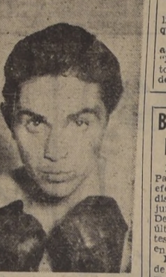
ALBERTO REYES.— Prosigue intensamente sus entrenamientos para la pelea que sostendrá con el uruguayo Porteiro.