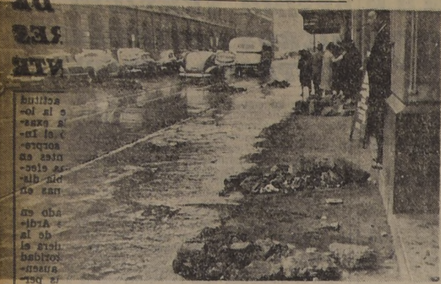
LA LLUVIA EN LA CAPITAL DE CHILE. — Los efectos de la lluvia ayer se proyectaron tanto en las calles más concurridas como en los barrios apartados. Las calles sin pavimento, las aceras destruidas, los desagües que no se limpiaron antes, convirtieron a la ciudad, por una simple lluvia, en lagunas y barrizales. La primera fotografía muestra a la calle Bandera