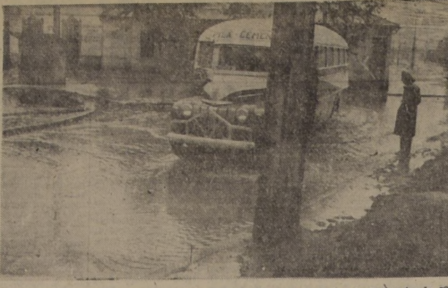
frente a la Bolsa de Comercio; la segunda, un aspecto de la Avenida Ecuador, y la tercera un microbus que "navega", por una avenida, hacia el centro. Esta información gráfica muestra clara-