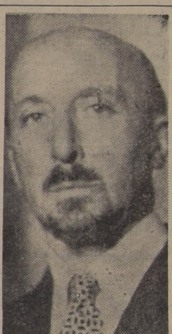
Don MAMERTO URRIOLAGOITIA, ex Mandatario de la vecina República