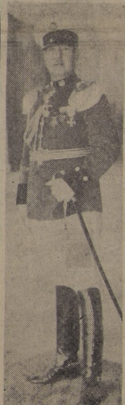
General don HUGO BALLIVIAN, Presidente de la Junta Militar de Bolivia, que asumió el mando de esa nación