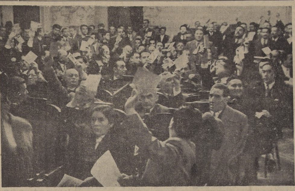
Con sus tarjetas de color rosa, en alto, los delegados de las diversas Municipalidades del país que concurren a la conferencia, votan, en particular, el proyecto que creó el organismo coordinador de gobiernos, comunales, aprobado ayer.