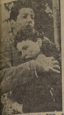
MALA POWERS y TOD ANDREWS, en la cinta R. K. O. "Ultraje"

Los esfuerzos de una muchacha para olvidar los momentos de terror que fuera víctima, son el eje de "Ultraje", la película de RKO Radio Pictures que se estrena el lunes en el Santa Lucia.