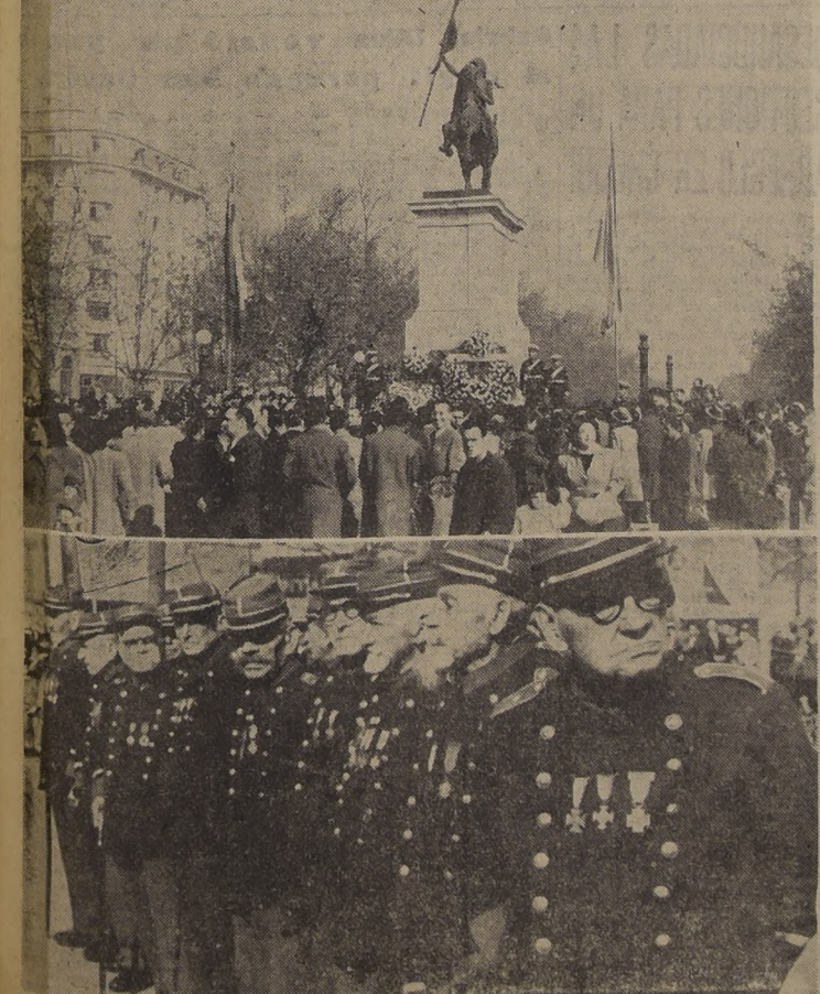
EL HOMENAJE ARGENTINO A SAN MARTIN.— Dos aspectos del homenaje rendido ayer a San Martín. Arriba puede verse el monumento al padre de la patria argentina, al pie del cual se colocaron hermosas ofrendas florales, en presencia de numeroso público. Abajo, un grupo de Veteranos del 79, que presenciaron las emotivas ceremonias en este monumento, y en el de Bernardo O'Higgins, en el que también se colocaron grandes coronas de flores.