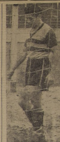
PUNTA AURINEGRO.— Punta, y uno de los defensores más parejos del Ferrobadminton...

El equipo de reservas de Colo Colo actuó en Rancagua frente al Centro Escuela N.º 1, empatando a 1 gol.