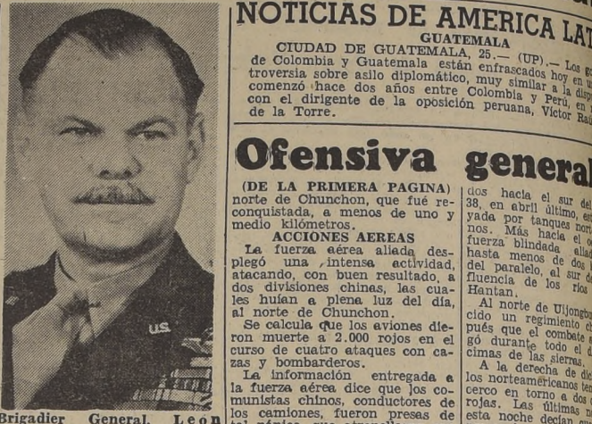
Brigadier General, Leon Johnson, que ha sido designado Comandante de la Tercera Fuerza Aérea de los Estados Unidos, con sede en la Gran Bretaña. Durante la Segunda Guerra Mundial el general Johnson comandó el Grupo de Bombardeo Pesado de los Estados Unidos, que participó en el teatro europeo de guerra.

El teniente general Van Fleet declaró, después de una visita hecha al frente de batalla: "Parece que la práctica de la persecución está dando buenos resultados".