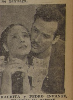
CHACHITA y PEDRO INFANTE, en "Nosotros los pobres", en el cine Santiago.