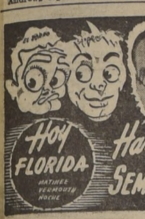
Andrews figura como un joven

Los esfuerzos de una muchacha para olvidar los momentos de terror que fuera víctima, son el eje de "Ultraje", la película de RKO Radio Pictures que se estrena el lunes en el Santa Lucia.