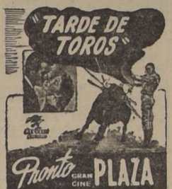
"TARDE DE TOROS" en el Cine Plaza

El conjunto de las Calendar Girls, formado por doce muchachas seleccionadas entre las más bellas de Hollywood, tiene especial lucimiento en la producción taurinológica del sello Columbia, "La modelo incógnita", que se estrena el martes de la semana próxima en el Teatro Central.