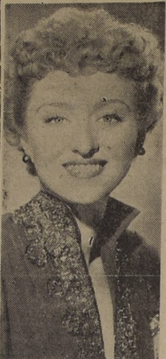
CELESTE HOLM, actúa en "La malvada".