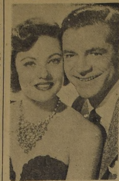
Gene Tierney y Dana Andrews

El martes en el cine Real se estrenará "Cuando termina el cam- mino", un drama presentado por la 20th Century Fox, que animan Gene Tierney, Dana Andrews y Gary Merrill. La dirección perte- nece a Otto Preminger.