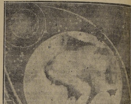
Marte, tal como se ve en la oposición más cercana a tierra

Por J. G. Porter Traducido y adaptado para "LA NACION", por G. V.