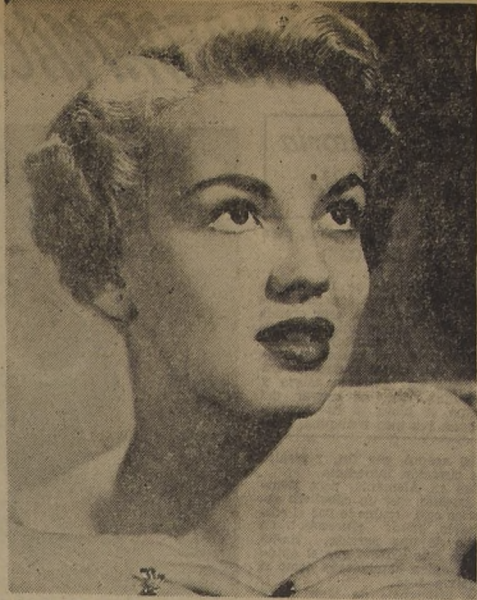
La celebrada starlet Joan Evans es una de las figuras principales en la nueva película "Edge of Doom", distribuida por R. K. O.

Y así continúan las cosas. Cada nuevo descubrimiento estimula a ambos bandos a formular más esmeradas explicaciones. Tal vez el gran telescopio de 200 pulgadas de Monte Palomar nos será de ayuda en la oposición de 1956. Este instrumento es capaz de tomar instantáneas de Marte, y en una sucesión de centenares de fotografías, puede ocurrir la buena suerte de que alguna de ellas logre captar a Marte en perfectas condiciones de visibilidad.