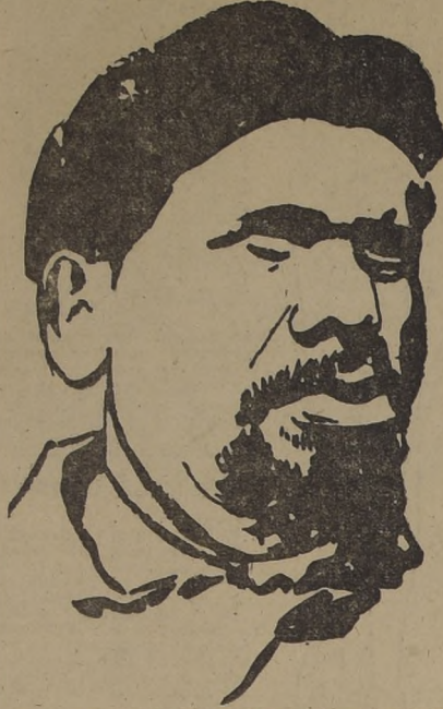
El general español Valentín González, apodado "El Campesino"