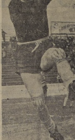
LOS PARTIDOS SE GANAN CON GOLES. - Esto parece que se le olvidó ayer al Ferroadmirante...