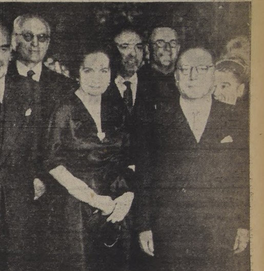
LA FIESTA NACIONAL DE ITALIA. — Los actos en celebración del Día Nacional de Italia, alcanzaron ayer extraordinario brillo. El Embajador, Excmo. señor Alberto Berio, rindió en la mañana homenaje a O'Higgins, colocando una hermosa ofrenda floral al pie de su monumento. Luego recibió los saludos del Gobierno, de sus conacionales, y en la tarde ofreció, en su elegante residencia una recepción social a la que correspondió la fotografía. En ella aparecen el Canciller don Horacio Walker y el Excmo. señor Berio, y su esposa, con algunos de los asistentes a la brillante fiesta.