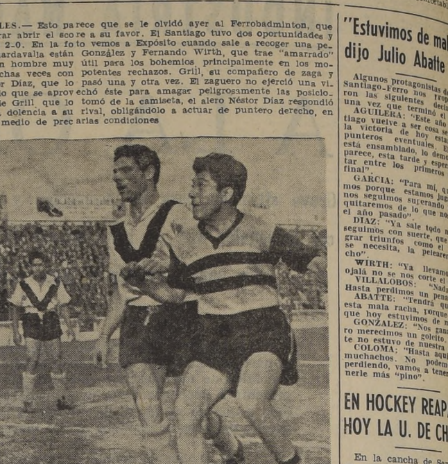
Green Cross con Unión Española se enfrentarán en Santa Laura