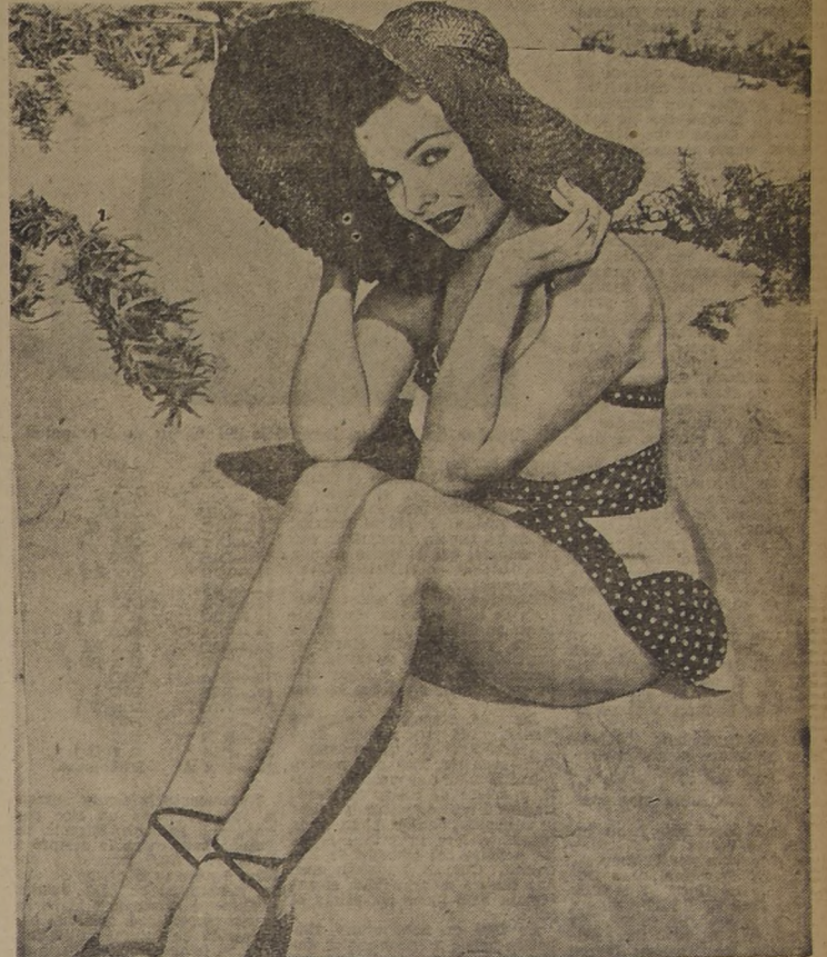
La fascinadora Jeanne Crain toma un baño de sol en una colina de arena a orillas del mar, en California, durante un intervalo de descanso en la filmación de una nueva película.