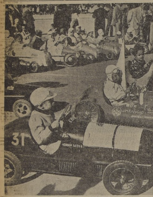
NIÑOS CHILENOS TRIUNFAN EN ARGENTINA. Se efectuó recientemente en Mendoza una competencia automovilística infantil...

La Asociación de Arbitros de Santiago ha hecho para hoy las siguientes designaciones oficiales: