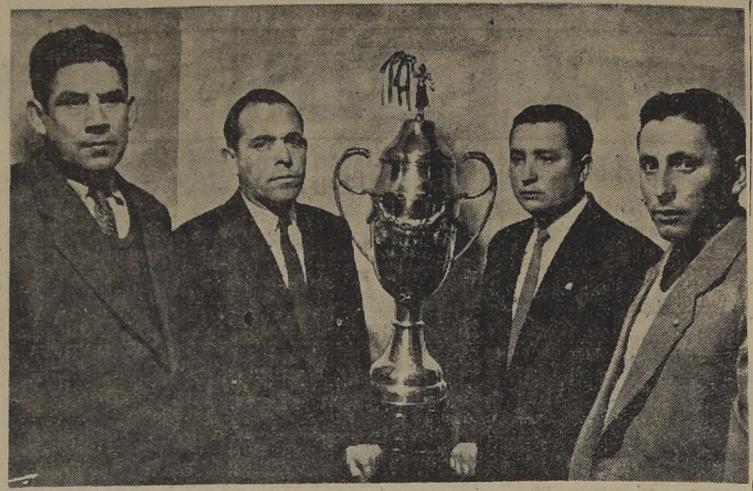
TROFEO "SEDERAP" PARA LIGA ELECTRICA. La Casa Sederap obtuvo el hermoso trofeo que con los dirigentes de la Liga Eléctrica de Deportes...