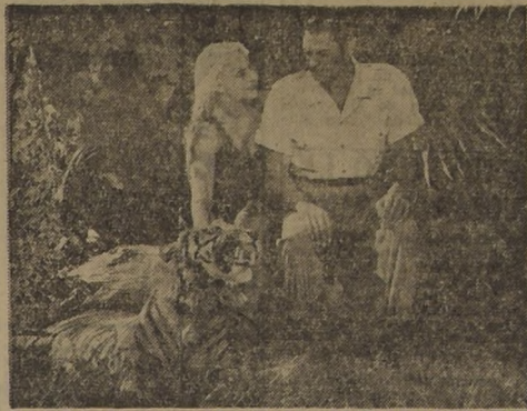
Una escena de "La mujer leopardo", film Columbia, que va al Teatro Continental

Una trama argumental apasionante, es la que se desarrolla en la película de aventuras de la selva, "La mujer leopardo", que Columbia Pictures presentará desde el martes próximo en el Teatro Continental. Cabe destacar una espectacular lucha entre una serpiente y una pantera negra, combate que ha sido captado en forma magistral por las cámaras.