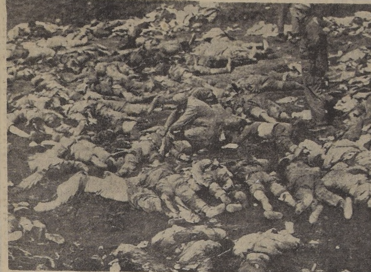
COREA DEL SUR. — Una ligera idea del enorme número de bajas sufridas por los comunistas en su última gran ofensiva, da esta gran cantidad de soldados chinos muertos. Yacen, precisamente, en el mismo sitio en que cayeron combatiendo en una lucha con los infantes de marina con armas cortas, que duró diez horas.

Desde las primeras horas de la mañana de ayer, la Base del Comodoro O'Higgins, en la Antártida, está siendo azotada por un temporal de viento y nieve, que ha reducido a todos sus interiores al interior de la casa. La fuerza del viento ha alcanzado a 140 kilómetros por hora y la temperatura ha descendido a 12 grados bajo cero. Este es uno de los primeros temporales que ha soportado la Base, que se hizo cargo de la Base el 23 de enero del presente año.