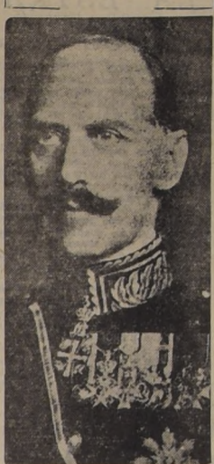
LONDRES, 5 (UP).— El Rey Aakon VII de Noruega, llegó en una visita oficial a bordo de su yate, siendo recibido por el Duque de Gloucester en nombre del Rey Jorge VI, quien se encuentra enfermo y residiendo en su familia real, le esperaba en sus habitaciones. La Reina Elizabeth y otros miembros de la familia real le esperaron en el muelle para darle la bienvenida.