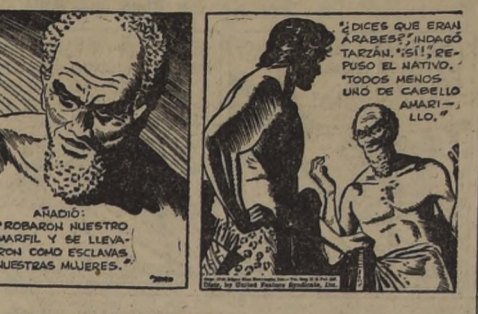
ADICION: "ROBARON NUESTRO MARFIL Y SE LEVANTARON COMO ESCALVADOS NUESTRAS MUJERES."