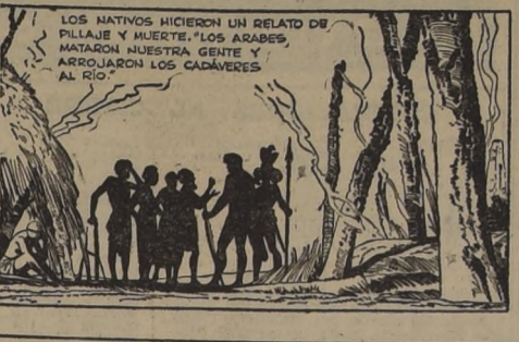
LOS MATIVOS HICIERON UN RELATO DE PILLAJE Y MUERTE...