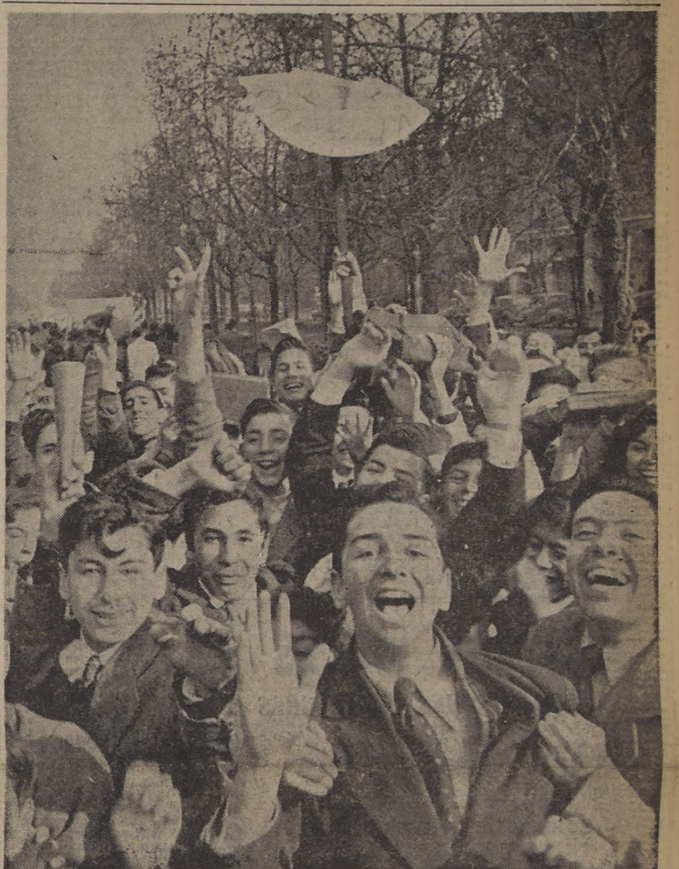
PARO ESTUDIANTIL. — Sólo tres horas duró el paro nacional decretado por el Comando Nacional de Estudiantes Secundarios. Los dirigentes, después de hablar ante dos mil muchachos reunidos en la Plaza de Armas, acordaron dar por terminado el paro. Luego fueron recibidos por el Ministro de Educación, don Bernardo Leighton, quien en vista del sano acuerdo y buena voluntad de los dirigentes, prometió dar pronta solución a los problemas que aquejan a la enseñanza, principalmente lo que se refiere a los locales escolares. El paro, tanto en Santiago como en provinciales, no registró ningún incidente de importancia, salvo el producido frente al Liceo 3 de Niños, donde un grupo de muchachos lanzó dos piedras y un petardo al interior del edificio. El grabado muestra a un grupo de alegres huelguistas, en la Alameda, llevando motes alusivos.

NORFOLK, Virginia, 5. — (UP.) — Los investigadores del Departamento de Incendio están examinando los carbonizados restos del almacén de depósitos de la Corporación de Ventas de Salitre y Yodo de Chile, para determinar la causa del incendio que destruyó ese almacén y 22 vagones cargados de salitre. Los bomberos trabajaron hasta las últimas horas de anoche, para controlar el fuego y un cálculo extraoficial fijó los daños entre 500.000 y 570.000 dólares. En el almacén había 60.000 toneladas de nitrato de sodio, altamente inflamable. En los momentos de producirse el incendio, estaba siendo descargado el vapor chileno "Alamo", pero no sufrió daño por el fuego. Esta nave también conducía nitrato. El incendio aparentemente se debió a fricción en la cinta del transportador mecánico desde el barco al almacén.