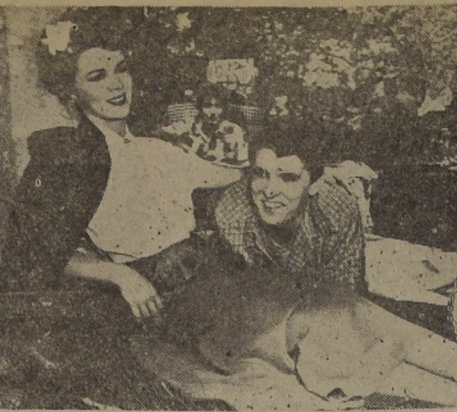
Sally Forrest y Keefe Brasselle, en una escena del film "La tragedia del temor" que estrena hoy el Bandera.

Leo Films estrenará hoy en el cine Bandera, la emotiva producción dirigida por Ida Lupino "La tragedia del temor", protagonizada por Sally Forrest, la nueva luminaria descubierta por Ida. El film relata el dramático caso de una muchacha que es víctima de la parálisis infantil y siendo dan-