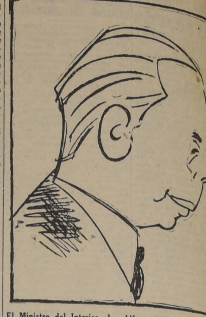
El Ministro del Interior, don Alfonso Quintana Burgos, decide —de una vez por todas— iniciar una fuerte batalla contra la vagancia y la mendicidad callejeras, con medidas prácticas y rápidas.