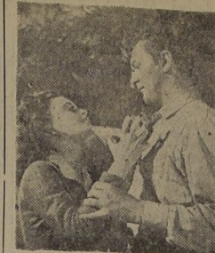
Un gran trabajo realizan Faith Domergue y Robert Mitchum en "La Rosa Blanca".

Unidos por un amor violento y pasional al que se agrega después el peligro, la emoción y una fuga con una persecución desesperada, Faith Domergue y Robert Mitchum ofrecen una de las cintas más fuertes de los últimos tiempos en "La rosa blanca", que la R. K. O. Radio Pictures presentará desde el martes que viene en el Teatro Central.