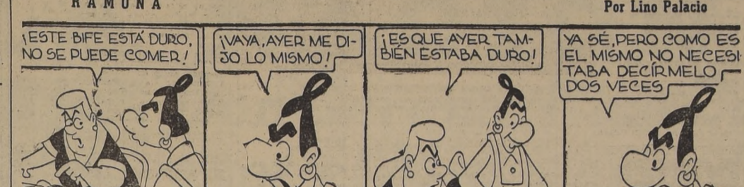
ESTE BIFE ESTÁ DURO, NO SE PUEDE COMER!