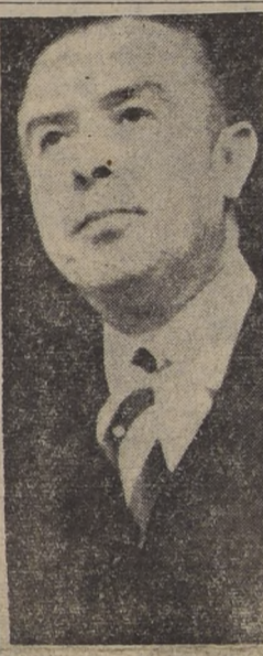
Excmo. señor González Videla, que formuló enérgicas declaraciones ante la actitud de un sector del comercio minorista.

Frente a la amenaza de un paro nacional indefinido del comercio minorista para el caso de que el proyecto de Delito Económico sea aprobado por el Congreso, el Excmo. señor Gabriel González Videla declaró anoche su protesta más enérgica y su solemne resolución de "respetar y hacer respetar la autonomía de los Poderes Públicos y el libre ejercicio de las atribuciones que la Constitución Política les otorga".