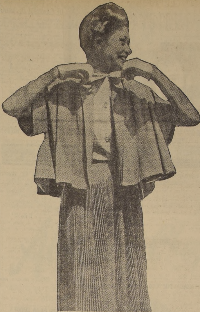
ELEGANTE TRAJE DE DOS PIEZAS.— Este hermoso conjunto es de uso muy práctico. La falda plisada soñe es acompañada por una blusita blanca y un bolero de gran amplitud.

Si ustedes desean estar a la última moda durante la temporada que se inicia, harán uso de los colores negro, blanco y gris. Estos fueron los colores más en uso en la reciente exhibición de modas en París. Y, como era de esperarse, Nueva York adoptó los mismos. ¿Por qué los modistos y diseñadores escogieron esos tonos? Evidentemente porque decidieron que por mucho tiempo el factor importante de la piel había sido dejado a un lado. Ellos manifiestan que esos tres colores, más que ningún otro, hacen de la piel de la mujer el factor más importante. En cuanto al material y a las telas de moda, en París y Nueva York el último grito para 1951 es el algodón. Casi todas las latinoamericanas tendrán oportunidad de presenciar una atractiva exhibición de modas en breve. La Reina del Algodón de los Estados Unidos recorrerá Sud América a bordo de uno de los lujosísimos aviones DC-6 de la Braniff International Airways. La jira ha sido promovida por el Consejo Algodonero de los Estados Unidos y la compañía de aviación Braniff. Esta será la primera vez que la Reina del Algodón visite Sud América.