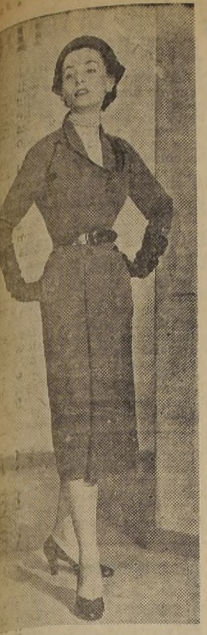
Este modelo de media estación, diseñado por norteamericano Hans Bang, es en lana gris. El corte de la falda, formando un ancho lablón al sesgo adecuado, sujeto por dos botones, y cuello, son sumamente novedosos y sentadores.