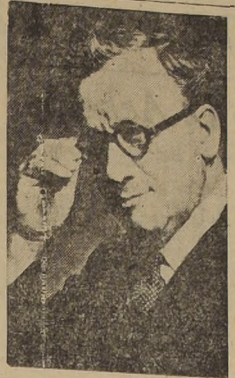
Herbert Morrison, Ministro de Relaciones Exteriores de Gran Bretaña, en una crítica situación con respecto al problema de la nacionalización de la Anglo-Iranian Oil Company.

Sorteo este Sabado 30 más de 11 millones de pesos, con un gordo de $ 5.000.000