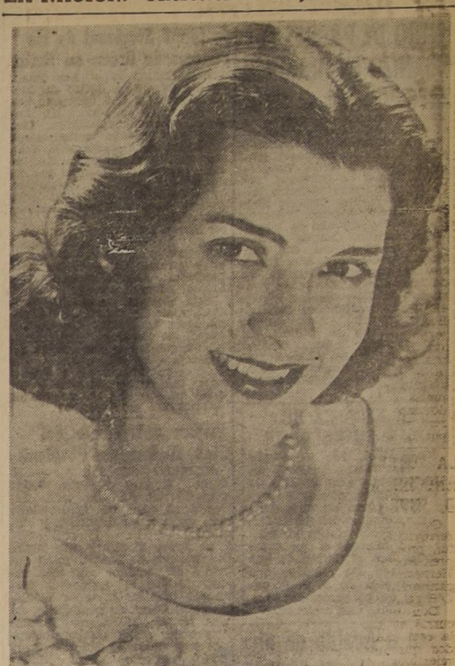
La llegada a Santiago, anunciada para el 30 del presente, de Miss Holland, Reina del Algodón, ha despertado vivo interés en los diversos círculos de la capital. El Consejo Algodonero de los Estados Unidos y la compañía de aviación Braniff, que auspician esta jira por América Latina, han programado para su estadía en Santiago varios actos que constituirán la atracción de la temporada.

La piel del recién nacido está cubierta de una substancia que se limpia con facilidad si se le untan aceite de oliva o vaselina, dejándola así un rato para que se ablande. Naturalmente que durante este tiempo hay que mantener a la criatura bien abrigada para que no se enfrie. El agua del baño debe estar a una temperatura un poco más alta que la del cuerpo, lo cual puede comprobarse por la ligera sensación de calor que se siente al meter el codo en el agua. Se lava escrupulosamente todo el cuerpecito con jabón puro, cuidando que éste no entre a los ojos. Después de secarle sin brusquedad con toallas suaves, se le coloca sobre el ombligo un apósito de gasa esterilizada con un agujero para que pase el cordón umbilical, y luego se pone encima de éste otra compresa para cubrirlo. El apósito se sujeta con una faja de franela, que debe tenerse preparada de antemano para este fin. A no ser que el apósito se humedezca o se ensucie, es mejor no cambiarlo por varios días. El cordón umbilical se seca y desprende generalmente una semana después del nacimiento; la cicatrización del ombligo tarda otra semana más.