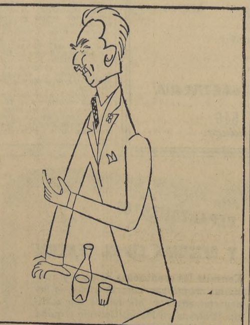
Dean Acheson, Secretario de Estado en USA, que ha manifestado su escepticismo con respecto al discurso pacífico de Malik en el seno de la NU.