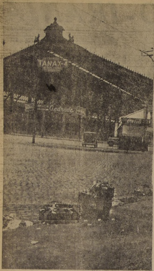
BASURA EN LA PLAZA ARGENTINA, LUNAR DE SANTIAGO. Frente a la Estación Central, a la una y media de la tarde, aún se retiraban la basura en el costado norte de la Plaza Argentina, sector que, pese a todos los planes municipales de transformación, embellecimiento y aseo, continúa siendo un lunar de Santiago.