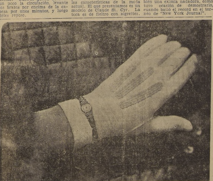
Para vestidos de noche, los Fabricantes de Relojes de Suiza han creado este elegantísimo modelo de reloj femenino, realmente original. La caja del reloj, muy delicada y en oro, tiene la cuerda en la parte posterior, lo que le da al reloj la figura de una circunferencia completa y sin obstáculos. Las asas del reloj son en filigrana de oro, con dos diamantes en cada lado. El cristal es del tipo de cubo de hielo, sólido y elegante. Este modelo de reloj suizo, con áncora de rubies 1951, ha llamado poderosamente la atención entre los críticos de modas del continente.