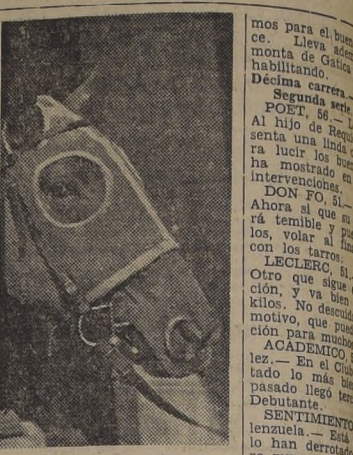
CATALPA, lleva opción en la prueba de fondo del Hipódromo Chile y está pagando excelente dividendo.

Aquí tratamos de ubicar las mejores chances en las carreras programadas para las tres últimas de programa que, por lo demás, son las más interesantes. Vamos viendo: OCTAVA SERIE.— 1.200 metros. Cuarta serie.— Handicap. PACHUCO, 53.— J. Espinoza. Ganó el viernes, como quien dice para "ponerse" completamente fácil. Su repetición es harto probable.