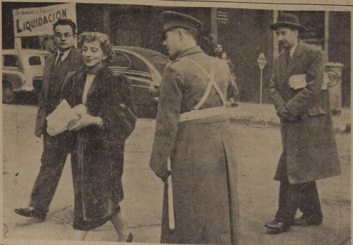
CARABINEROS ENSEÑA A LOS PEATONES. — Precisas instrucciones ha recibido el Cuerpo de Carabineros para enseñar los reglamentos del tránsito a los peatones, actores y causantes en muchas ocasiones de graves accidentes. Aquí vemos cómo uno de los carabineros del tránsito, en Agustinas con Morandé, instruye a los peatones sobre la forma en que deben cruzar la calzada.