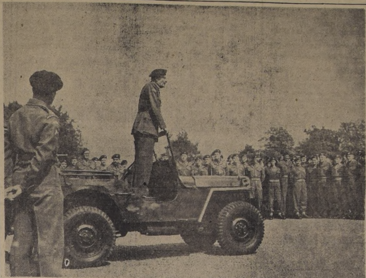
EL MARISCAL MONTGOMERY INSPECCIONA EL EJERCITO.— El Mariscal de Campo Lord Montgomery, Supremo Comandante Adjunto de las Fuerzas Aliadas en Europa, visitó el campamento militar de Aldershot, para inspeccionar la Brigada de Paracaidistas. Lord Montgomery tiene por misión en las Fuerzas Armadas Europeas, todo lo relativo a la organización, equipo, entrenamiento y movilización de esos ejércitos occidentales.

FEDERACION DE COOPERATIVAS AGRICOLAS LECHERAS