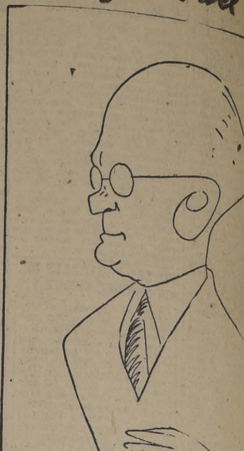
Dr. Reginald Atwater, experto en Salud Pública, de los Estados Unidos, que se halla en Santiago para imponer de las pañas preventivas de enfermedades y de saneamiento.