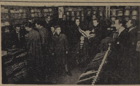
Un aspecto de la Sección Niños que ha sido visitada por miles de clientes durante la Liquidación

Ayer nos fué dable visitar, brevemente, el local para varones de Falabella, en Ahumada N.º 242. Numerosos clientes estaban ahora aprovechando la venta extraordinaria de los saldos en la Sección Ternos Confeccionados para caballeros y jóvenes, en el primer piso. En el subterráneo, las Secciones Camisería, Zapatería, Sombreados, Artículos de Fantasia y, muy especialmente, la Sección Niños, exhiben todavía apreciables cantidades de mercaderías, especialmente esta última, que son ventajosas oportunidades que ofrece a los pequeños clientes. Los jefes de hogares o las madres sacan aquí el mejor partido para vestir bien a sus hijos. La Sección Damas de Falabella se ha caracterizado siempre en nuestra capital, porque impone en cada estación la última expresión de la moda femenina. Sus diversas dependencias exhiben remanentes de elegantes trajes-sastre de corte inglés, francés y norteamericano; abrigos en variedad de modelos; batas en colores muy atractivos. Todas estas mercaderías son confeccionadas en telas finas, importadas y nacionales. También quedan saldos de trajes para deportes, campo y playa. La Liquidación de Invierno de Falabella, ahora con su venta de saldos, terminará indefectiblemente la próxima semana. Ella ha puesto una nota de animación en la ciudad y ha beneficiado a miles de personas.