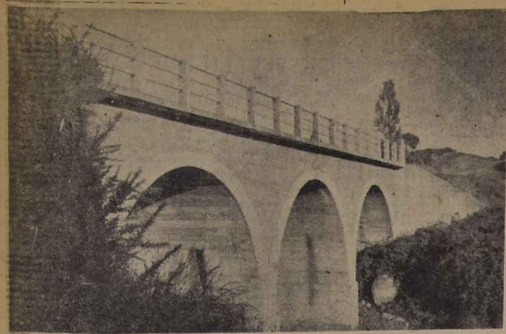
Frente "Damo", en el camino longitudinal, en el sector comprendido entre Collipulli y la ciudad de Victoria, terminado en el año 1949, que presta grandes servicios para el intenso tránsito de vehículos en esta importante zona agrícola y comercial de la provincia de Malleco, donde el Departamento de Caminos de la Dirección General de Obras Públicas está llevando a cabo un vasto plan de obras camineras.