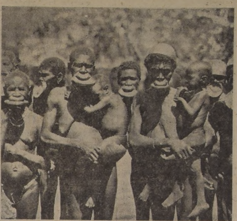
"Congo Salvaje", dentro de un argumento apasionante, muestra genuinos aspectos del continente negro, como estos extraños nativos

Nunca se había logrado presentar al público de nuestra ciudad, una película tan extraordinaria como "Congo salvaje", que sigue exhibiéndose en el rotativo Opera, en segunda semana. Esta película que es comentada en todos los círculos por su atrevimiento en presentar hechos ignorados de las selvas salvajes y sus habitantes, demoró tres años en ser filmada. Se puede asegurar que no es una película más, sino una verdadera joya de la cinematografía actual, y que nos ofrece escenas jamás captadas anteriormente por las cámaras. "Congo salvaje", que distribuye la 20th Century Fox ha batido todos los records de taquilla del cine de la calle Huérfanos, donde chicos y grandes se reúnen para conocer este documental, que, será imposible de admirar en otra oportunidad.