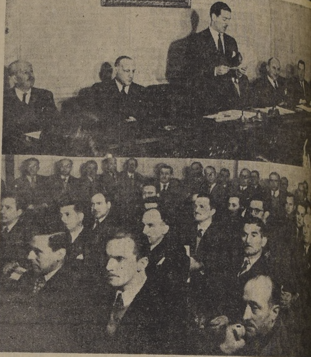
I.—La mesa directiva de la Asociación, y el señor Alessandri. II.—Vista general de la reunión.