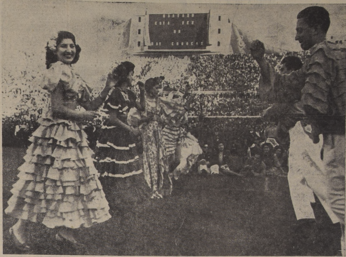
UN GRAN ESPECTACULO.— Números como éste y otros de gran categoría, darán color a la fiesta del deporte universitario del domingo próximo, con ocasión del "clásico" diurno de 1951. Las barras de ambas Universidades se han preparado con todo entusiasmo para cumplir una novedosa presentación.