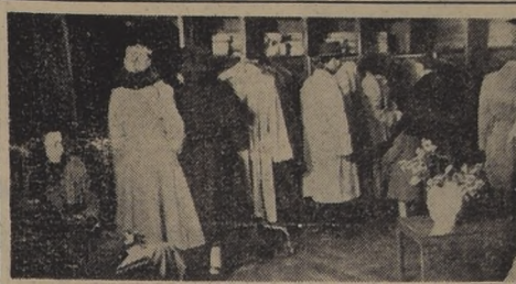
La Sección Damas ofrece al público los últimos saldos de trajes y abrigos de la temporada