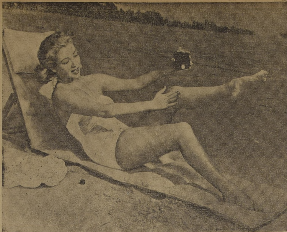
SE CUIDA LA PIEL. — HOLLYWOOD, agosto 1951. — La hermosa Mónica Lewis, que ha actuado en tres películas y que es brillante estrella de la televisión, tiene un método propio para el cuidado de la piel en la playa californiana. Se fricciona con un preparado especial, inventado por ella, a base de limón, aceite vegetal y esencia de rosas.