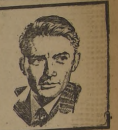
GREGORY PECK, tiene destacada actuación en "Agonía de amor", film de gran éxito en el Central.

Gracias a la iniciativa de Clara Oyuela maestra del Curso de Opera del Conservatorio Nacional, se ofrece todos los martes en el Salón Sur del Hotel Carrera, un interesante ciclo musical destinado a dar a conocer en forma completa la obra de Debussy.