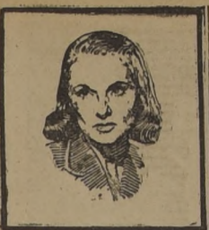
ANN TODD, es una de las protagonistas de "Agonía de amor" que va en segunda semana en el Central.