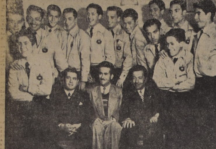
ESTUDIANTES ECUATORIANOS EN "LA NACION." Una delegación de 17 estudiantes ecuatorianos y cinco profesores del Instituto Nacional "Mejía" de Quito, se encuentran en Santiago...