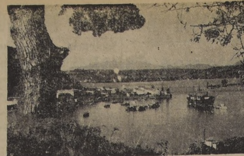
FUZA DE ANGELO, sector pintoresco de Puerto Montt, a donde llegan lanchas y otras embarcaciones...