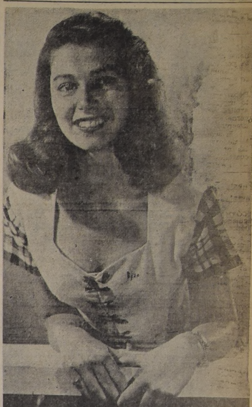
PIER ANGELI, la atrayente artista de M G M., captada durante el rodaje de "Teresa" (La historia de una novia), película que se exhibirá por primera vez en una función a beneficio de la obra social Parroquia San Roque, en el Teatro Metro. Esta velada se efectuará el miércoles próximo, a las 22 horas, y ha sido organizada por la obra social "The Elizabeth Bayley Seton Charity of Chile".