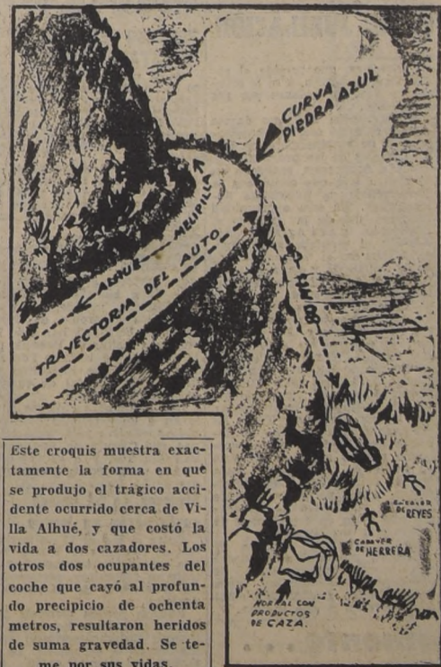
Este croquis muestra exactamente la forma en que se produjo el trágico accidente ocurrido cerca de Villa Alhué, y que costó la vida a dos cazadores. Los otros dos ocupantes del coche que cayó al profundo precipicio de ochenta metros, resultaron heridos de suma gravedad. Se teme por sus vidas.