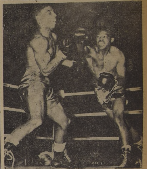
SIN CONTADORES. — En el estudio de valores hecho por la Asociación Nacional de Box de Estados Unidos, el único campeón para el cual no le encuentran rivales oficiales es Ray Robinson, a quien vemos en esta escena que corresponde a su victoria sobre el británico Turpin.