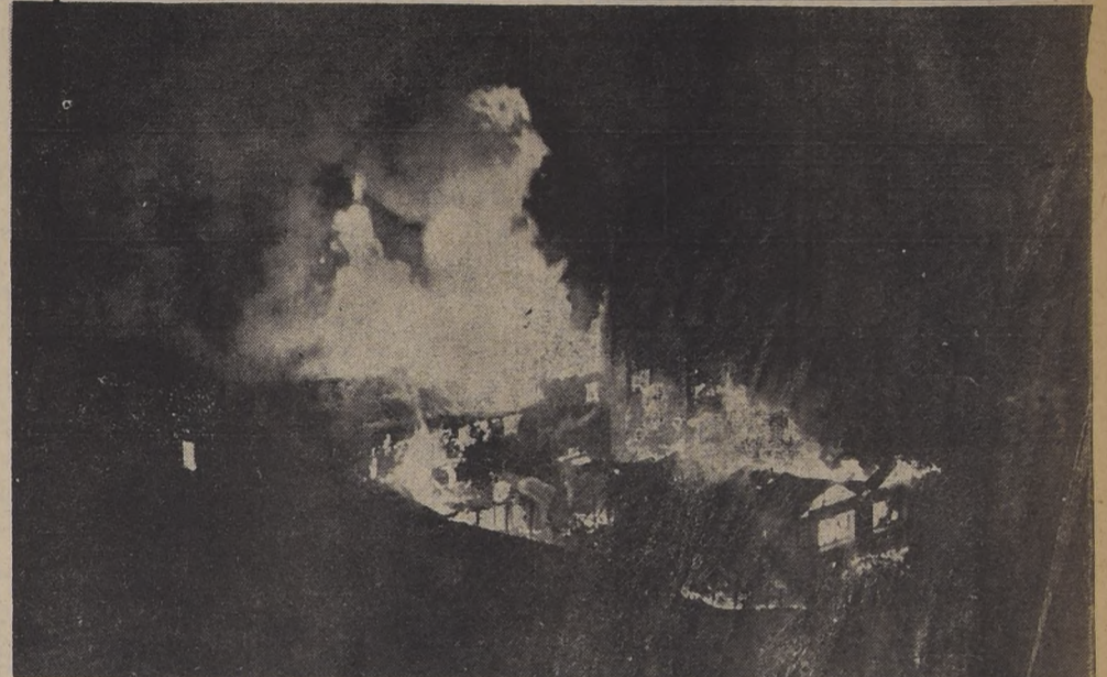
INCENDIO DE LAGUNILLAS. — Solo la vieja campana del Refugio del Club Andino de Chile, en Lagunillas, pudo salvarse del siniestro ocurrido en los días de Fiestas Patrias. Este grabado muestra el fuego en plena acción. Felizmente no hubo desgracias personales que lamentar. Los socios del Club Andino, con un espíritu de acuerdo digno de elogios, empezaron inmediatamente una erogación para reconstruir todo lo perdido.

—Los intereses del país en los beneficios del cobre serán ampliamente respetados y considerados— dijo anoche el Ministro de Hacienda, señor Germán Pico Cañas, en una rápida entrevista concedida a LA NACION. —Tengo entendido —agregó el Ministro de Hacienda— que las dificultades que se habían presentado recientemente ya han sido solucionadas satisfactoriamente para el país. Sin embargo, no puedo anticipar mayores informaciones al respecto, porque las conversaciones sobre esta materia son llevadas directamente por la Cancillería. Finalmente, el Ministro de Hacienda declaró que en los próximos días estaría en condiciones de proporcionar amplios antecedentes sobre todos los problemas relacionados con el cobre. Debemos recordar que las dificultades a que se refiere el señor Pico Cañas son las producidas en la Conferencia de Materiales Estratégicos, que está celebrándose en Estados Unidos, y en la que se propuso la distribución de absolutamente toda la producción de cobre del mundo. Como el Gobierno de