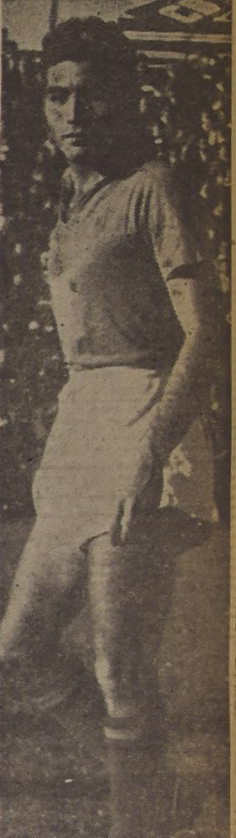
PELIGROSO. — No tanto como cuando empezó el campeonato...