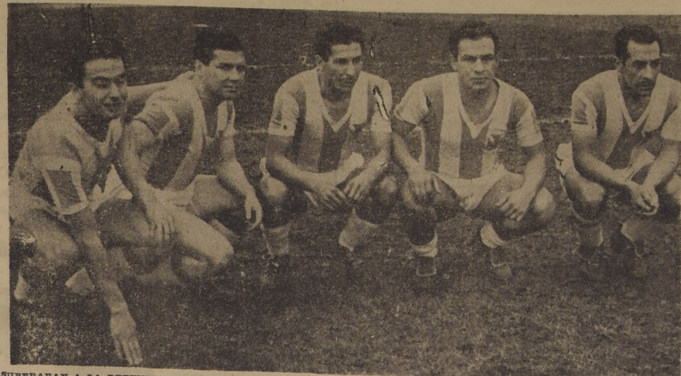
SUPERARAN A LA DEFENSA DE LOS ALBOS? — Difícil es, pero no imposible. Green Cross bien puede superarse y dar una sorpresa tremenda, como sería su triunfo sobre Colo Colo. En fin, todo puede suceder. En la foto la delantera de los alibverdes, donde forman Vázquez, Díaz, Aplolaza, Alderete y Navarro.