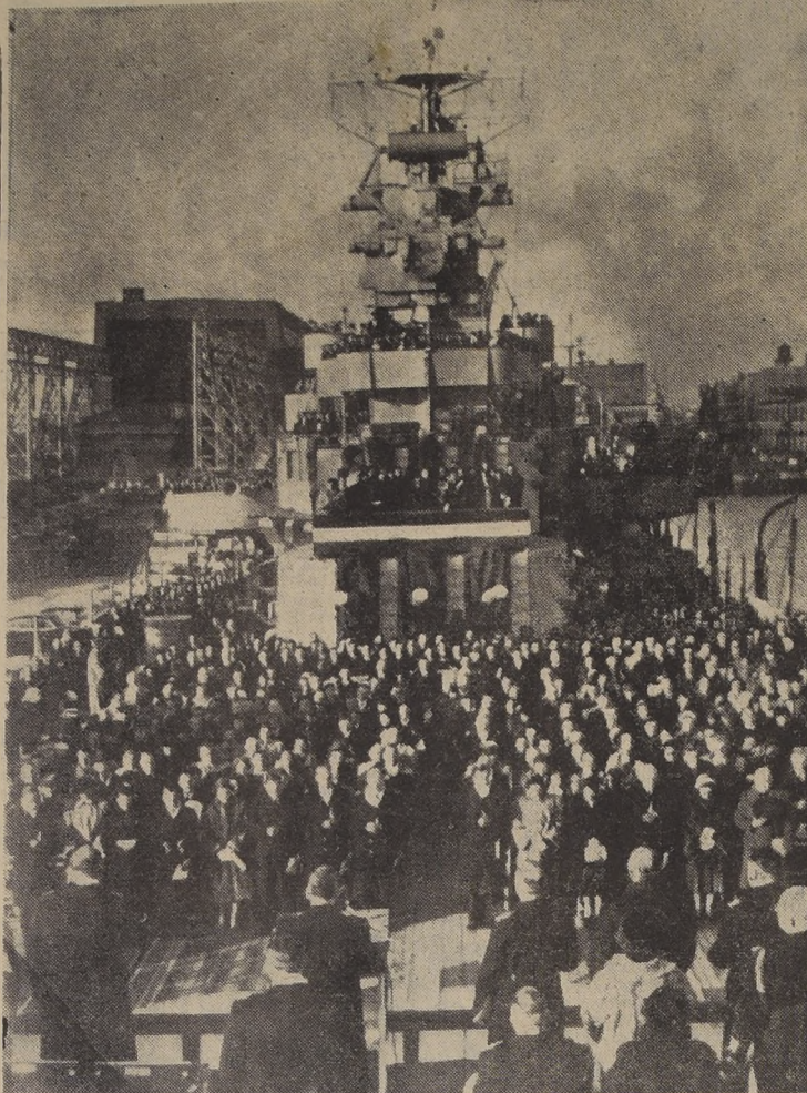
EL CRUCERO LIGERO "NASHVILLE" PASA A PODER DE CHILE CON EL NOMBRE DE "CAPITAN PRAT".— FILADELFA.— Vista general tomada en el momento en que en medio de una solemne ceremonia, el Gobierno de Estados Unidos hace entrega al Gobierno de Chile el crucero ligero "Nashville", el 21 de noviembre, siendo rebautizado con el nombre de "Capitán Prat".

BANGKOK (Tailandia), 30.—(U. P.)— Un consejo militar de nueve miembros ha impuesto un gobierno de hierro en este antiguo reino oriental, después de despojar al Premier Pridi Songgram de sus poderes administrativos, en una revolución en la que no hubo derramamiento de sangre. El Consejo Ejecutivo provisional, formado por tres del ejército, tres almirantes y tres jefes de la fuerza aérea ordenó la realización de una campaña inmediata para expulsar a todos los supuestamente comunistas del Gobierno. Pridi, Primer Ministro de tiempos de guerra bajo la ocupación japonesa, sobrevivió un breve levantamiento de elementos del ejército de la marina en julio pasado. El nuevo Consejo Ejecutivo pidió a las fuerzas armadas y a la policía, que mantengan una permanente vigilancia en la nación. Reina calma en esta ciudad. Se prohibió toda clase de reuniones militares y se impuso la censura de prensa. SAIKON (Indochina), 30.—(U. P.)— Según informaciones dadas a esta ciudad, la situación de Bangkok siguiente al golpe de Estado estuvo dirigido principalmente en contra del Parlamento y en contra de los realistas, enfluencia de los realistas en la víspera del regreso del Rey.