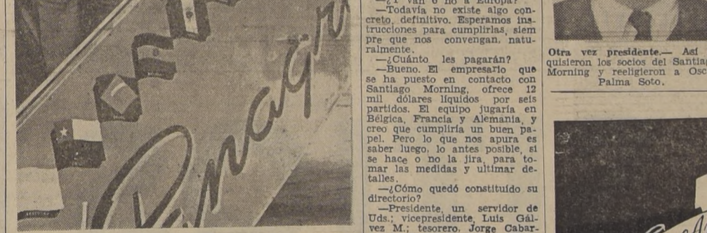
PARTIERON LOS EQUITADORES.— Por el avión especial DC-4, de Panagra, partieron ayer en la tarde a Buenos Aires, para luego continuar viaje a Europa por vía marítima, los equitadores chilenos que actuarán en la Olimpiada Mundial de Finlandia...