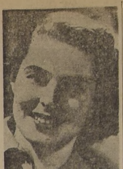
Ingrid Bergman es la estrella de la película "Cuéntame tu vida".